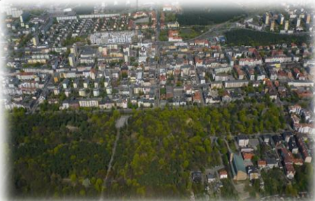
➤ Bydgoskie Przedmieście