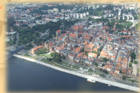
➤ Stare Miasto