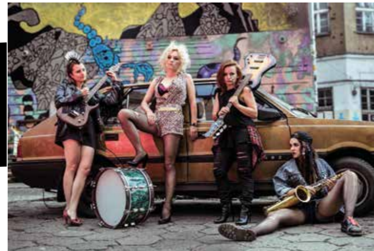
W punkowo-feministyczne klimaty wprowadzi grupa Pożar w Burdelu.