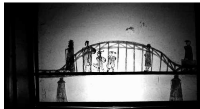
XXIV Międzynarodowy Festiwal Teatrów Lalek „Spotkania”, do 21.10., Teatr Baj Pomorski