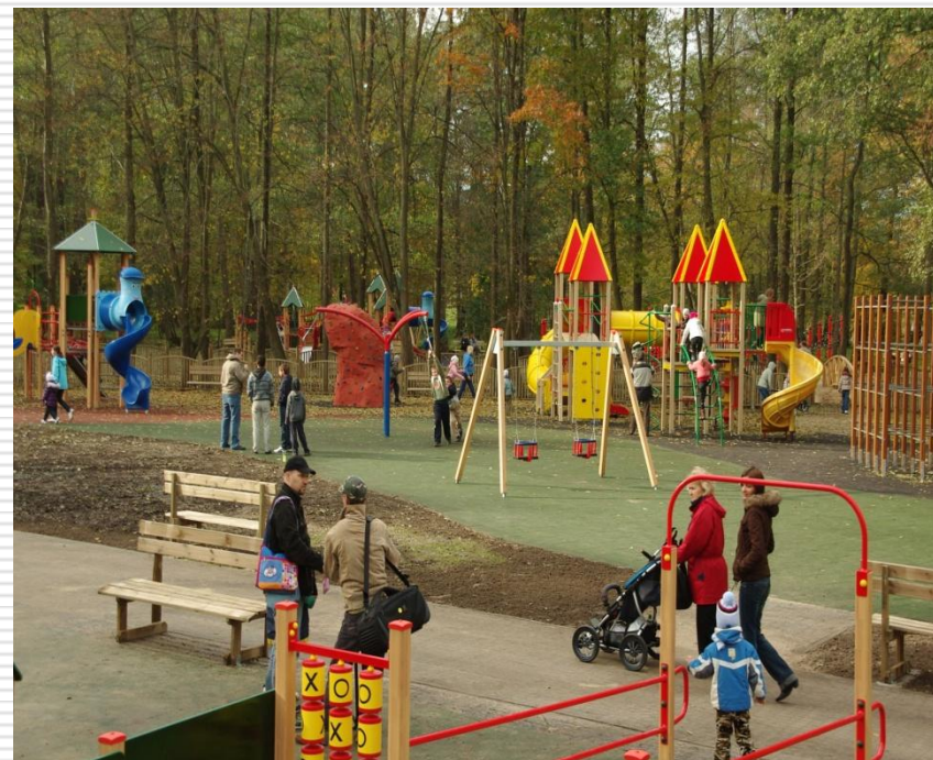
Wejherowo, Park Miejski po rewitalizacji, 2013 r.