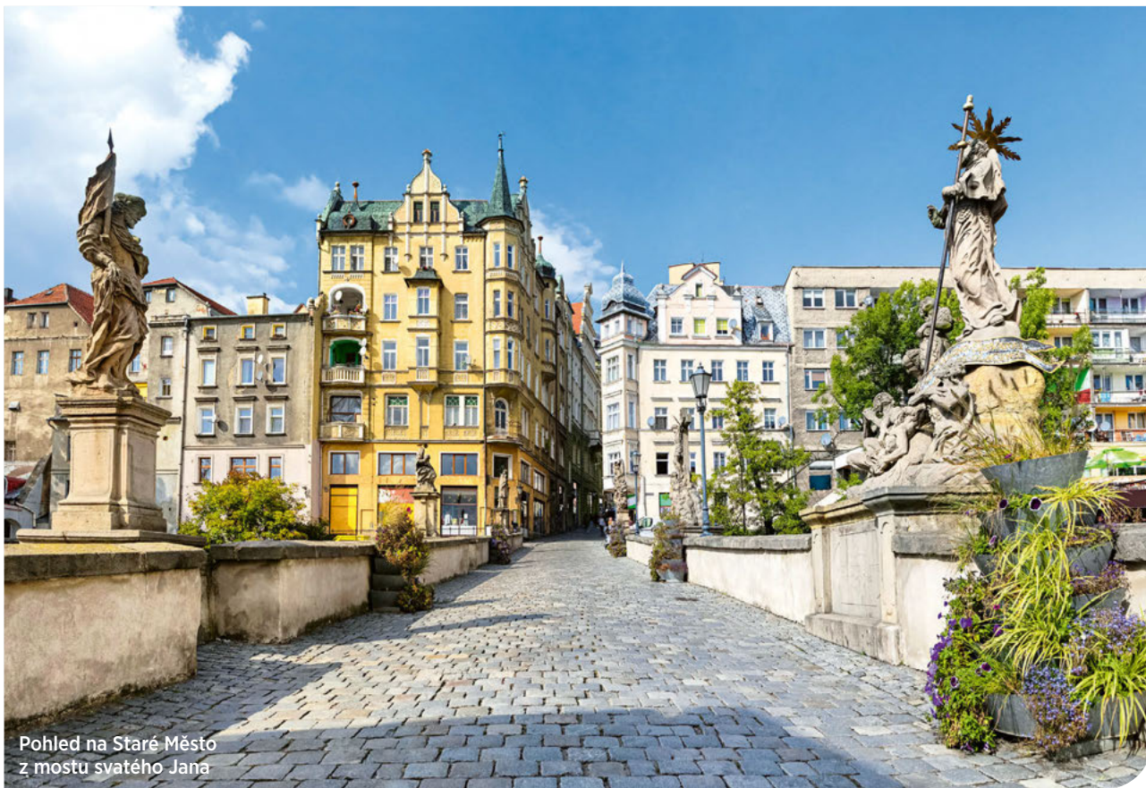
Pohled na Staré Město z mostu svatého Jana

Do Kladska, které najdete v jihozápadní části Polska, se kdysi jezdilo hlavně za nákupy. Pověstné tržnice Češi atakovali zejména během 90. let minulého století. Dnes vás překvapí malebné město, které nese stopy po vládě českých králů.