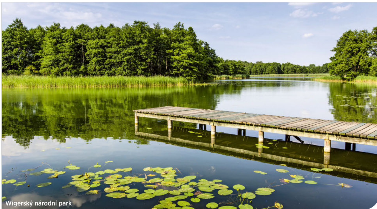
Wigerský národní park

Milovníci kempování a odpočinku v lůně přírody si zamilují kouzelný a dosud nepřiliš probádaný region, který se rozkládá u hranic s Litvou. Polská část regionu Suwałki se nachází v Podleském vojvodství a bývá často označována jako polský severní pól. V zimě tu totiž padají teplotní rekordy.