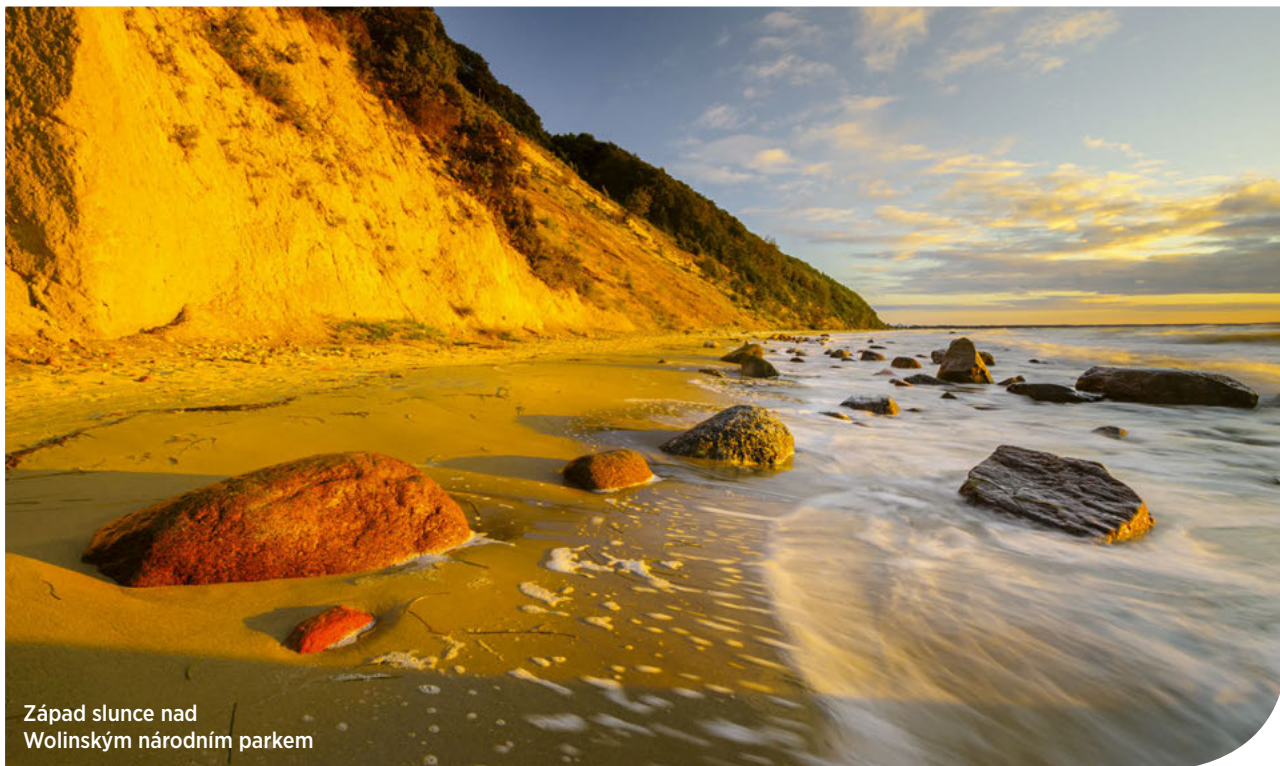
Západ slunce nad Wolinským národním parkem

Většinu polského ostrova, který má rozlohu téměř 5000 hektarů, pokrývá národní park. Nejkrásnější úsek útesového pobřeží, unikátní ostrovní delta řeky Świny i příbřežní pás vod Baltského moře, zůstává zachován pro budoucí generace. Přesto tu můžete najít jednu z nejlepších prázdninových destinací.