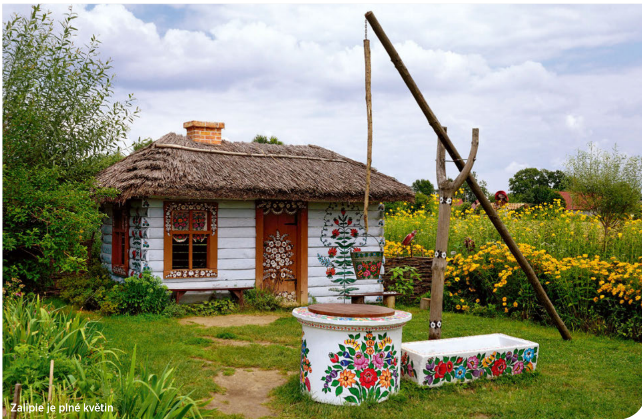
Zalipie je plné květin

Jedním z nejfotogeničtějších míst celého Polska je barevná vesnice Zalipie, ležící na jihovýchodě Polska v Dambrovském Povislí. Kouzelná obec za řekou Vislou vypadá jak vystřižená z dětské knížky. Někteří ji považují za mistrovské dílo, jiní za kýč. Jisté je, že o barevných květinových motivech se vám bude ještě dlouho zdát.