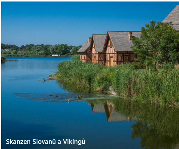
Skansen Slovanů a Vikingů