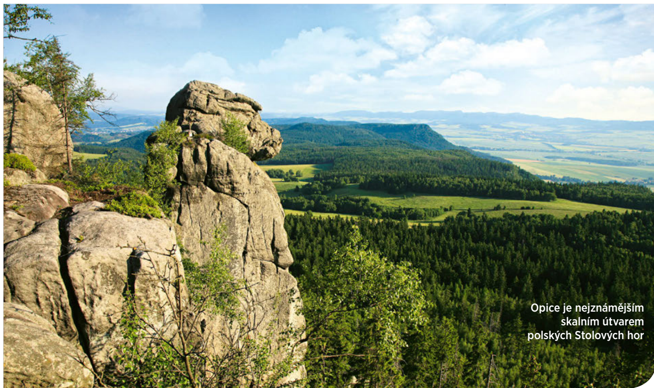
Opice je nejznámějším skalním útvarem polských Stolových hor

Jedno z nejkrásnějších sudetských pohoří právem patří mezi nejnavštěvovanější přírodní krásy celého Polska. Na své si tu ale přijdou i samotáři. Rozkvetlé louky, hluboké lesy i rašeliniště jsou domovem mnoha vzácných rostlin i živočichů a celé území je protkáno sítí turistických stezek.