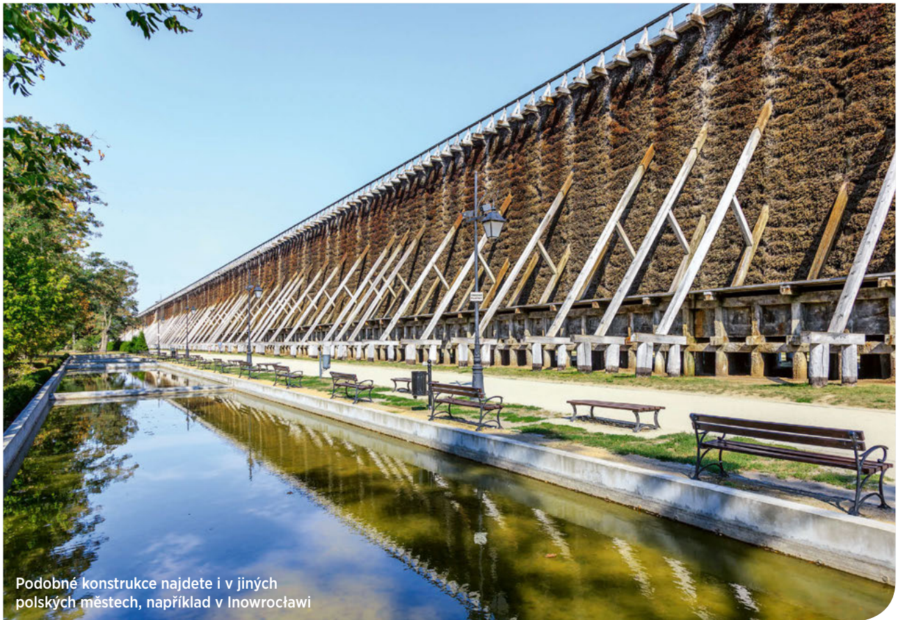
Podobné konstrukce najdete i v jiných polských městech, například v Inowrocławu

O tom, že sůl je nad zlato, se přesvědčíte například v městečku Ciechocinek. Balneologie neboli léčivý potenciál vody je jedním z nejstarších oborů lázeňství a o blahodárných účincích slaných termálních pramenů věděli už křižáci, kteří tady postavili solivar. Inhalační zařízení, známé jako Solankové věže, je největší v Evropě.