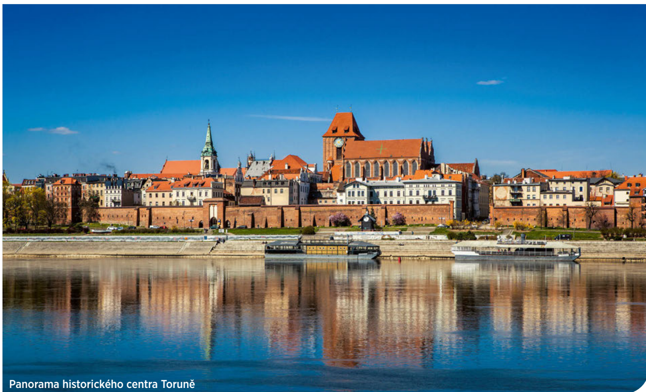
Panorama historického centra Toruň

Je jedním z nejstarších polských sídel a díky jedinečně dochovanému vnitřnímu městu je na Seznamu kulturního dědictví UNESCO. Zároveň náleží mezi sedm polských divů a turisty přitahuje nejen jako rodiště slavného polského astronoma Mikuláše Koperníka, ale také jako místo, kde se vyrábí vyhlášené medové perníky.