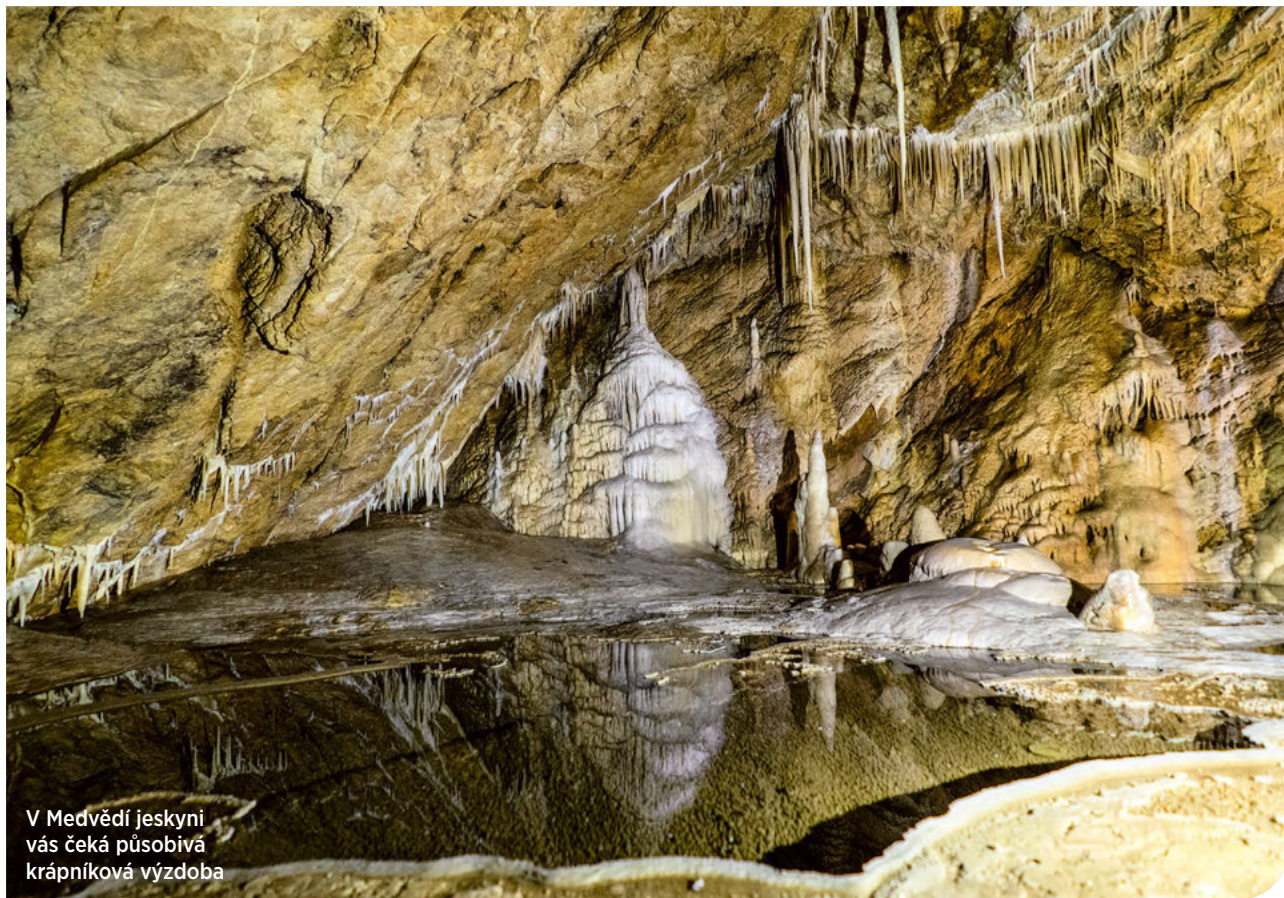
V Medvědí jeskyni vás čeká působivá krápníková výzdoba

Nedaleko českých hranic u polské obce Kletno najdete jeskyni jako z pohádky. A její název rozhodně není nahodilý.