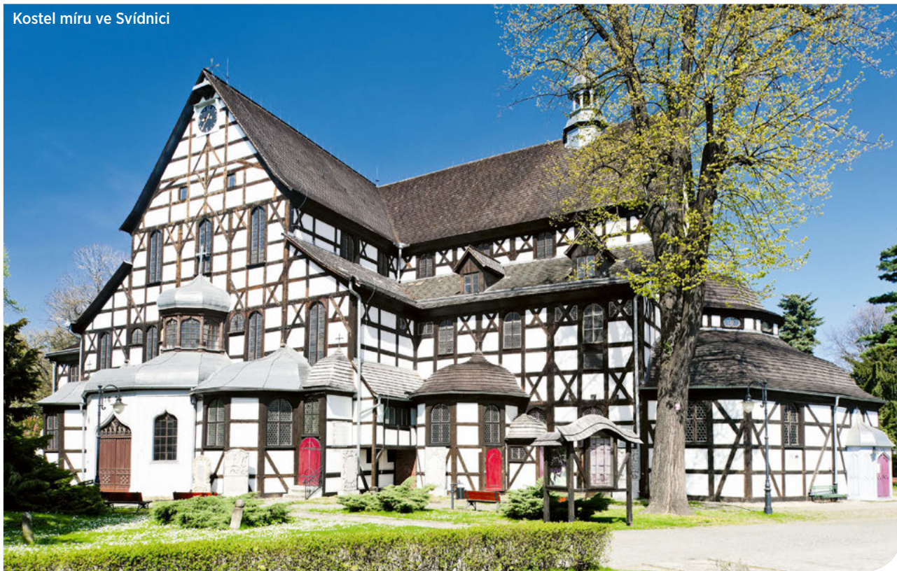
Kostel míru ve Svidnici

Unikátní hrázděné kostely míru ze sedmáctého století jsou nejen polskou chloubou, ale unikátem přímo v celosvětovém měřítku. Najdete je nedaleko od české hranice, v Javoru a Svidnici. Zvenku vypadají spíše jako obrovské stodoly. Vnitřní výzdoba je ale monumentálně barokní – i když se jedná o evangelické svatostánky, které obvykle vynikají spíše střídmostí než zdobením. Jenže tady si slezští protestanti chtěli vynahradit všechno, co v exteriéru nemohli.