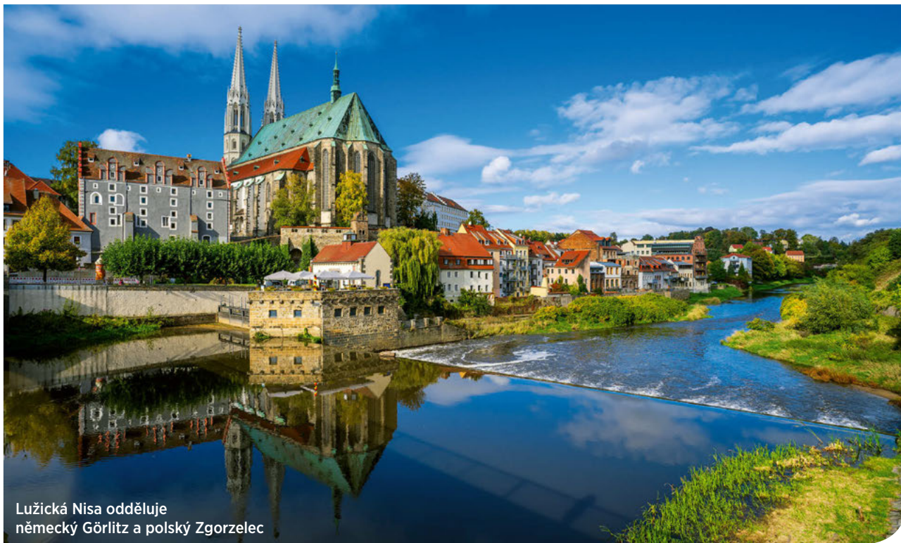
Lužická Nisa odděluje německý Görlitz a polský Zgorzelec

Na soutoku Lužické Nisy a Oldřichovského potoka se rozkládá česko-německo-polské trojmezí. Toto neobyčejné místo můžete prozkoumat třeba po cyklostezkách, které vedou po obou březích řeky.