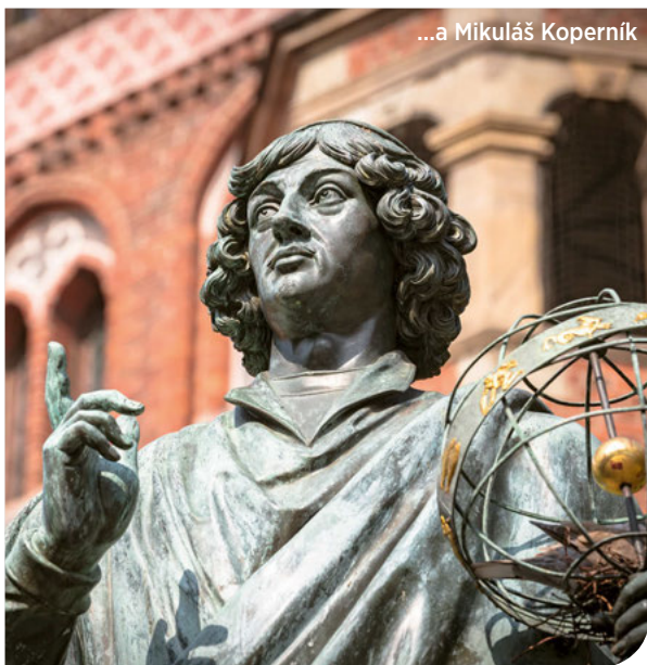
...a Mikuláš Koperník

Staroměstského náměstí v Koperníkově ulici. Jestli to bylo v domě, který dnes nese číslo popisné 15, nebo 17, není důležité. Oba nyní slouží jako jeho muzeum. Najdete tu jak astronomické pomůcky a historické spisy, tak spoustu zajímavostí z jeho života.