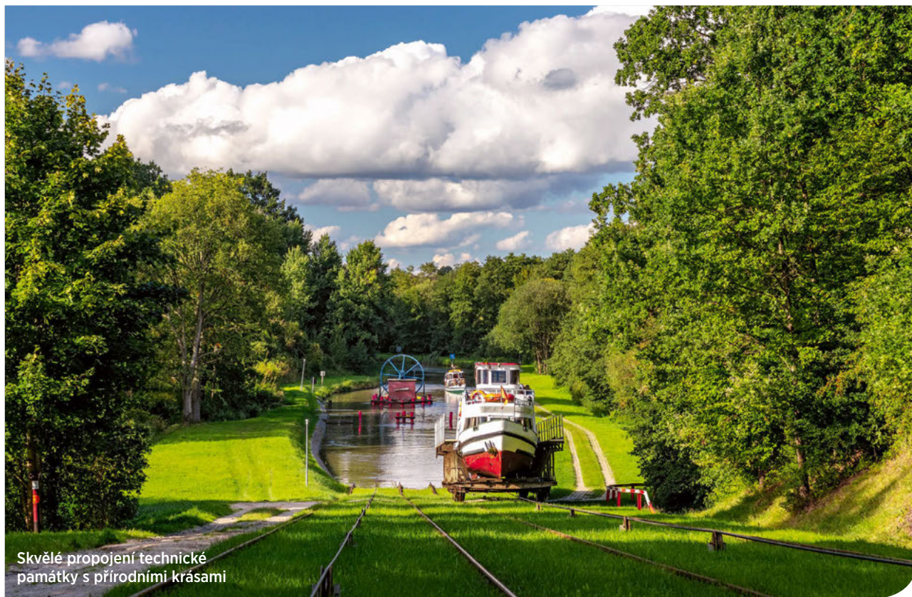
Skvělé propojení technické památky s přírodními krásami

Milovníci technických památek by měli vážít cestu do Varmijsko-mazurského vojvodství nedaleko města Elbląg. Nachází se tu totiž jedna z nejzajímavějších technických pamětihodností v celém Polsku. Dodnes funkční kanál je zároveň nejdelší splavnou vodní cestou v zemi.