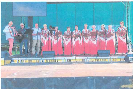
Foto relacja z Podgórskiego Pikniku Rodzinnego 27-08-2022