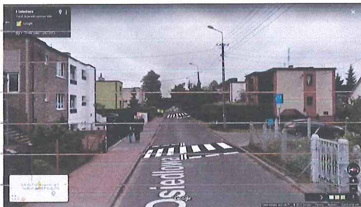
Zebry ujawniają skrzyżowania!!↑↑

Jedynie zebry chronią pieszego przechodzących przez ul. Osiedlową. Zebry dodatkowo wymuszają zwolnienie jazdy i ograniczają parkowanie, co poprawia widoczność.