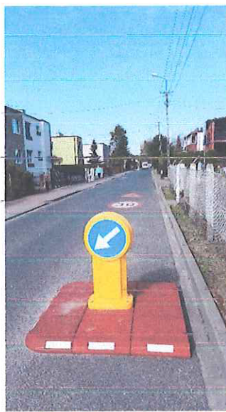
Ile teraz widać skrzyżowań? ZERO!