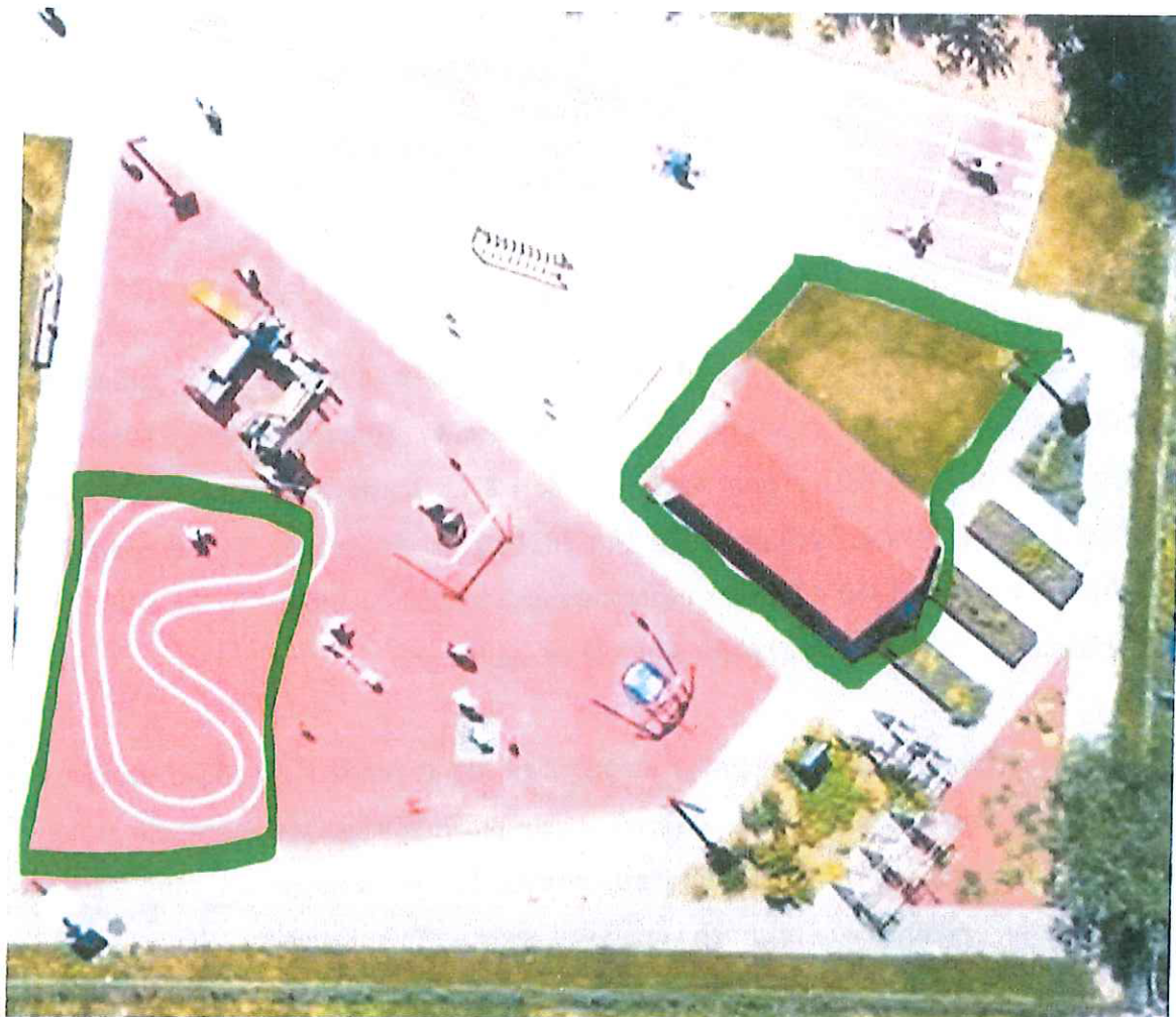
Załącznik nr 1 – Zdjęcie placu zabaw z lotu ptaka z zaznaczonym obszarem planowanych inwestycji