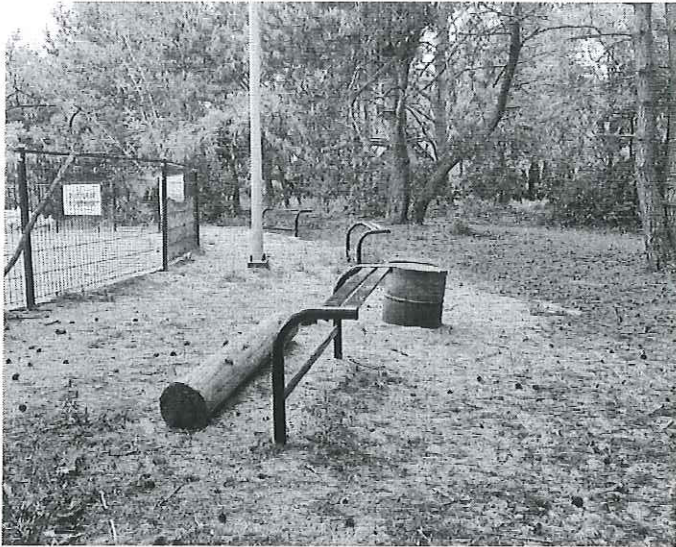
Zdjęcie nr 1 drugi łuk – widok miejsca gdzie mają być zamontowane trybuny i dosypany piasek za torem dla wyrównania terenu