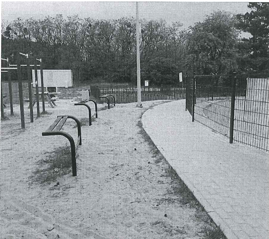
Zdjęcie nr 2 – pierwszy łuk - widok miejsca gdzie mają być zamontowane trybuny