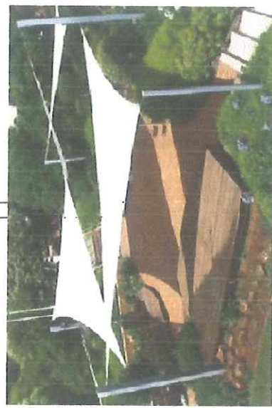
FOT. PRZYKŁADOWE ZACIEMNIENIE TYPU ŻAGIEL - PRZEMIDUJE SIĘ LOKALIZACJĘ MIN 2 TRÓJKĄTNYCH ŻAGLI NA 3 NOGACH KAŻDY