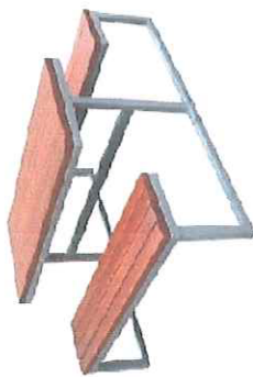
FOT. PRZYKŁADOWY ŁAWOSTÓŁ - PRZEMIDUJE SIĘ USTAWIENIE 6 SZTUK ŁAWOSTÓŁÓW

Projekt zakłada aranżację przestrzeni zewnętrznej przy szkole podstawowej Nr 34 w Toruniu i utworzenie klasy na świeżym powietrzu. W ramach projektu zostanie wykonana nawierzchnia trawiasta wzmocniona matą przerosową / lub nawierzchnia hybrydowa trawiasta/ ustawione zostaną ławki i stoły tak, by pomieścić 30 osobową klasę. Całość zostanie osłonięta od lekkiego deszczu i nadmiernego nasłonecznienia żagielm.