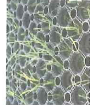
FOT. TRAWNIK WZMOCNIONY MATĄ PTZEROSTOWĄ