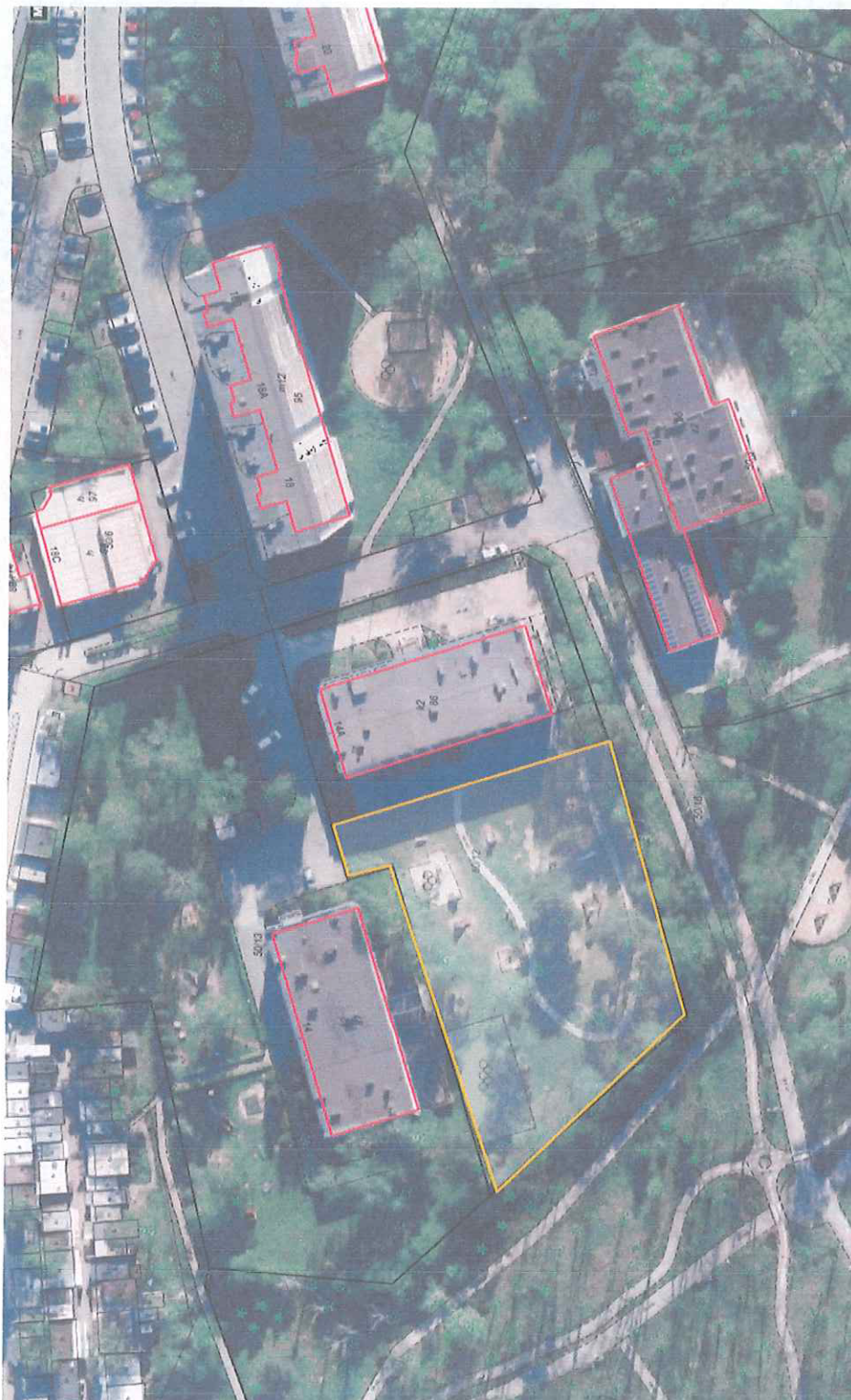
Figura. 1. Lokalizacja planowanego placu zabaw „Droga do Gwiazd” – teren zieleni przy Przedszkolu Miejskim nr 13 im. Mikołaja Kopernika w Toruniu