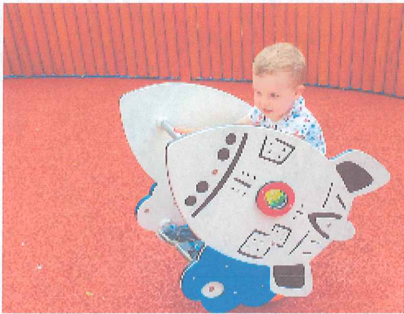
... .. ... ..