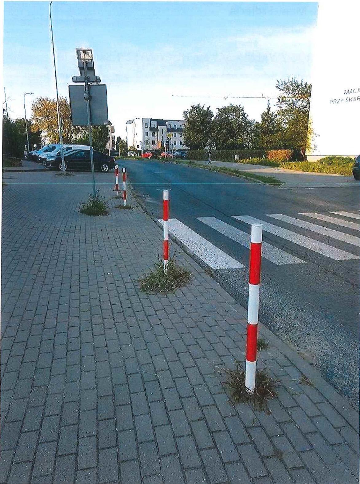
Zdjęcie nr 1. Widok miejsca przeznaczonego na projekt