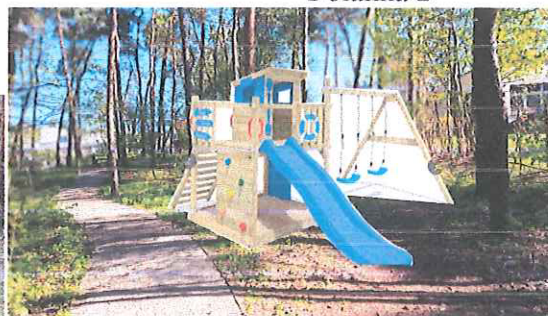
Plac zabaw dla dzieci na Cyplu, lokowany na drugiej polance i starej ścieżce.