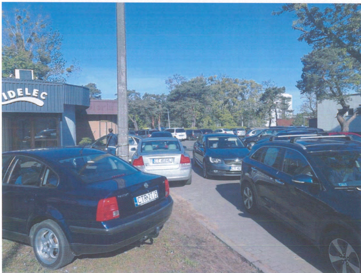
Codzienna sytuacja na parkingu u zbiegu ulic Sienkiewicza/Gagarina w godzinach porannych

kapiteł i komisji - walutane parkingu przy PM.17