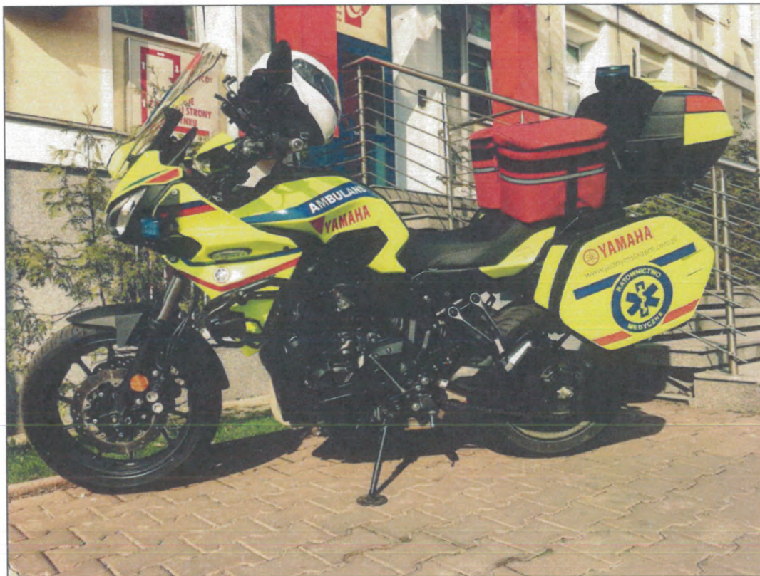
Motoambulans opracowany na bazie motocykla Yamaha Tracer 700