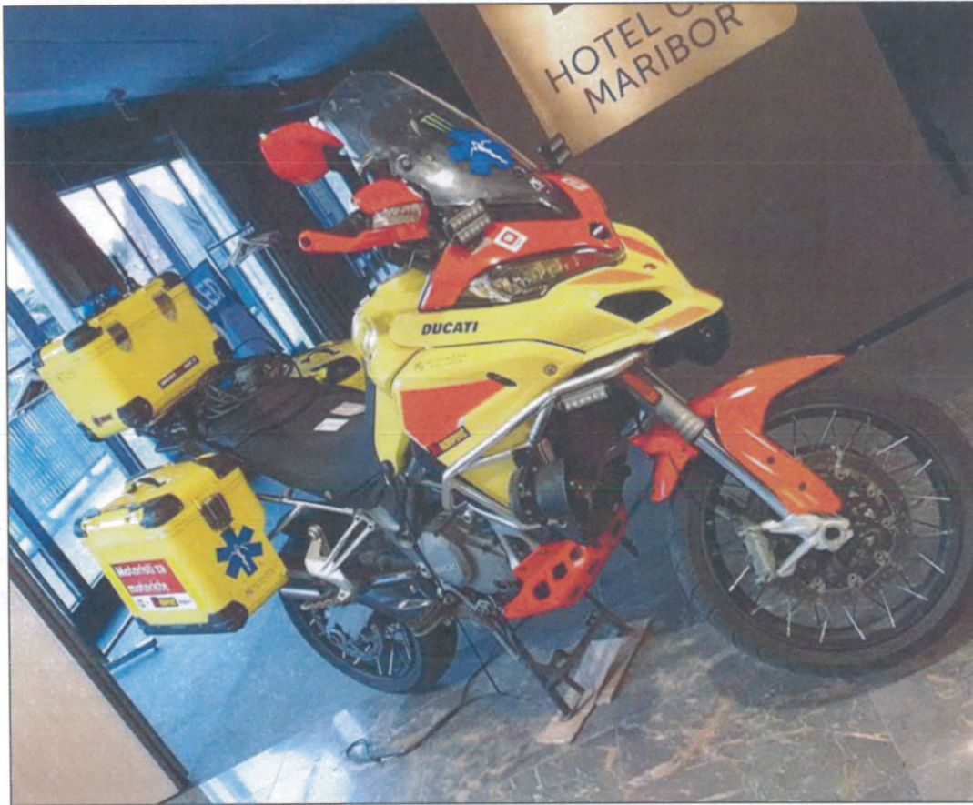
Motoambulans opracowany na bazie motocykla Ducati Multistrada