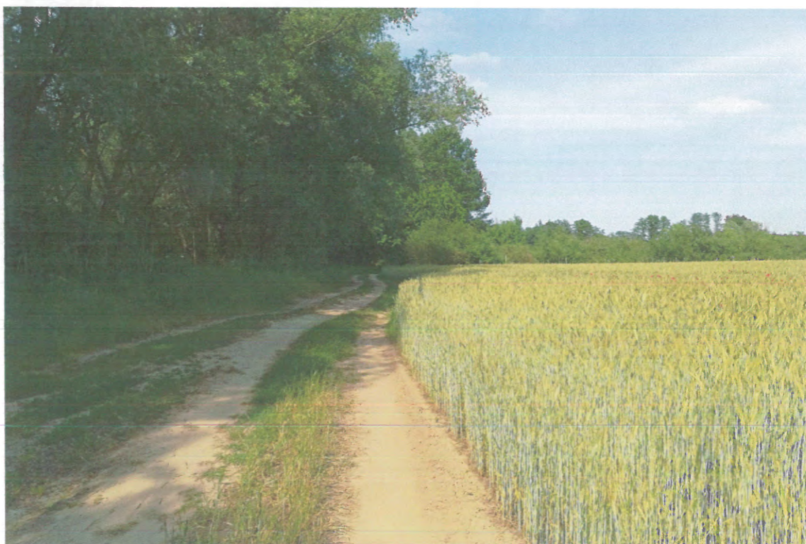
DROGA NAD WISŁĘ