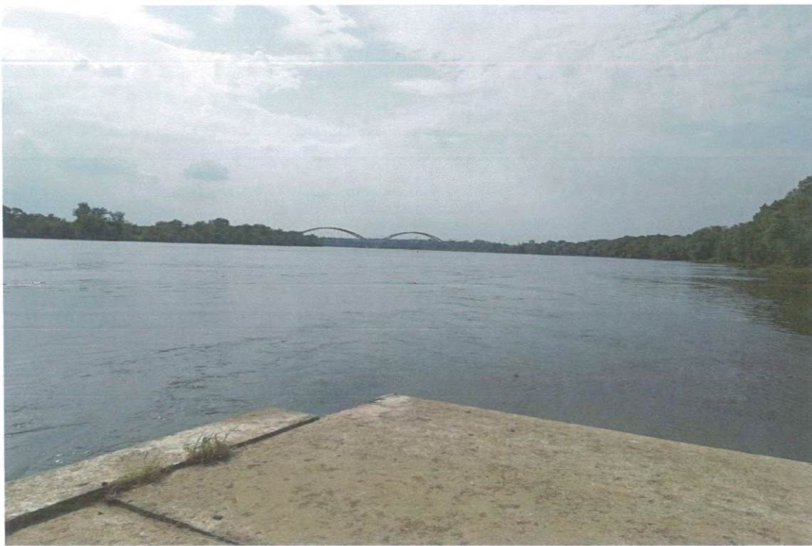
WIDOK NA MOST IM. GEN. ELŻBIETY ZAWADZKIEJ