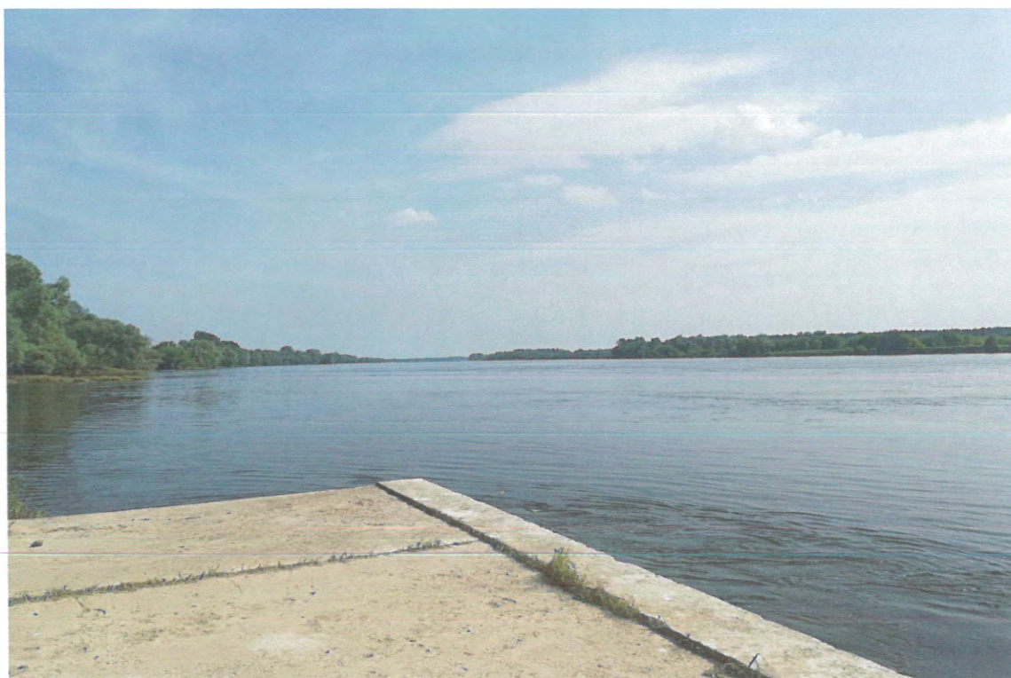
WIDOK W KIERUNKU WSCHODNIM