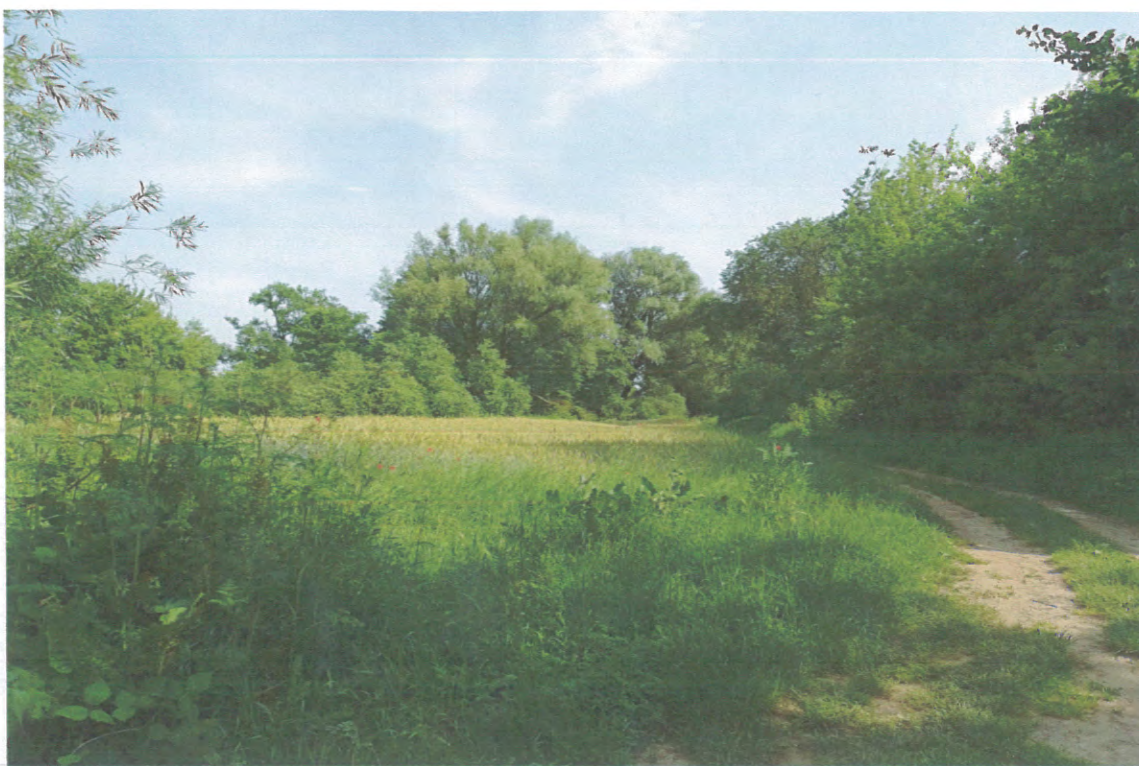
DROGA NAD WISŁĘ