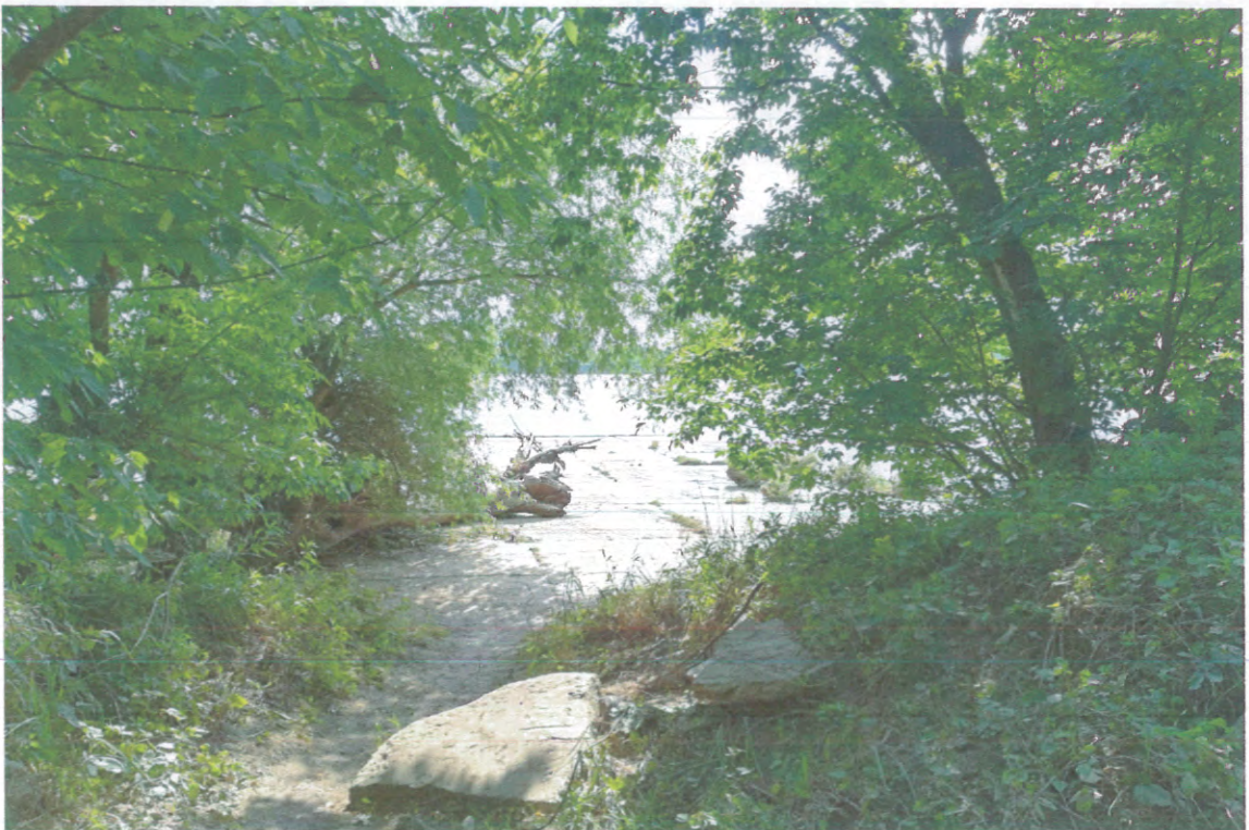
WEJŚCIE NA OSTROGĘ