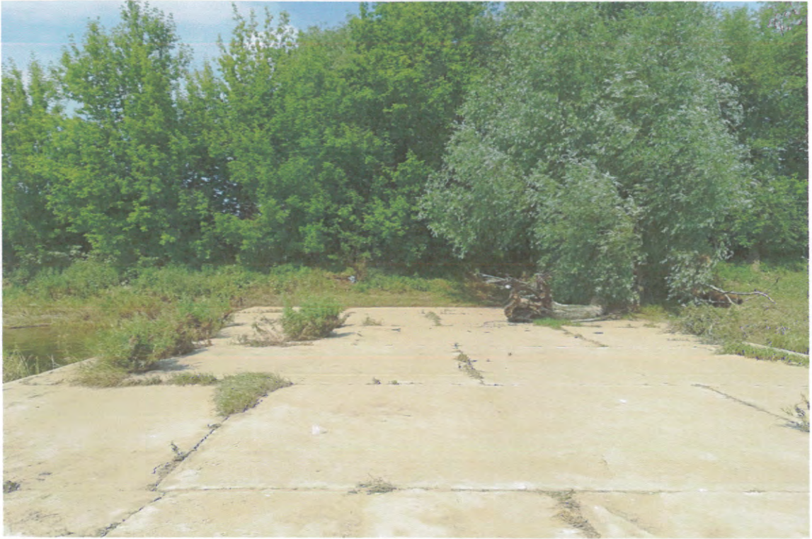
WIDOK Z OSTROGI NA SKARPE