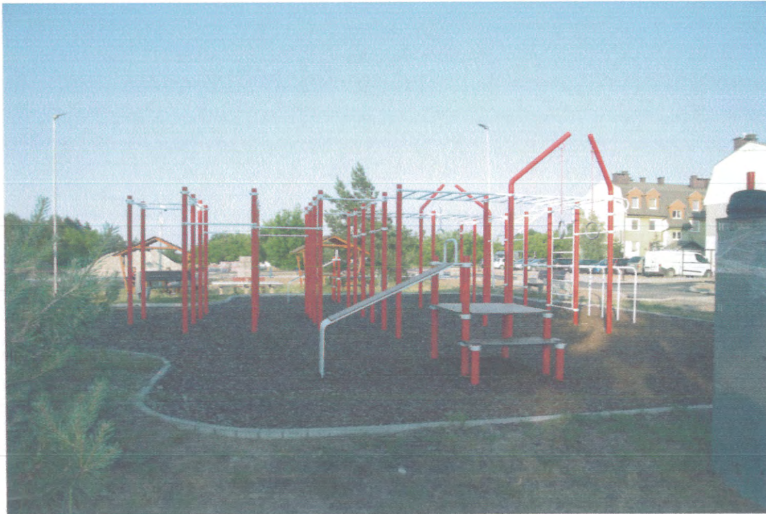
Widoczny teren z urządzeniami do ćwiczeń ogólnorozwojowych