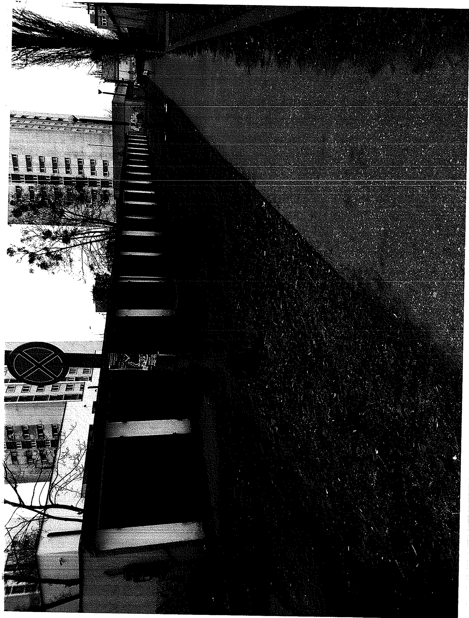
WIDOK OD UL. BAŻYŃSKICH