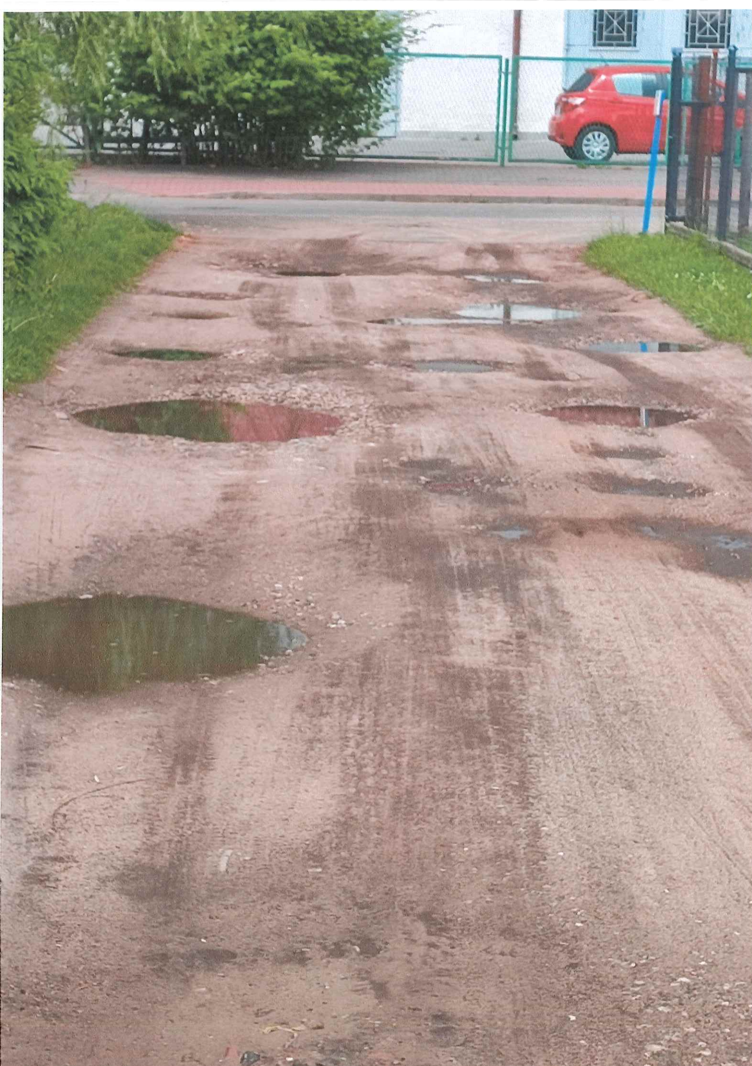
NJAZD DO WICY JDZIKOWSKIEGO 44C-F