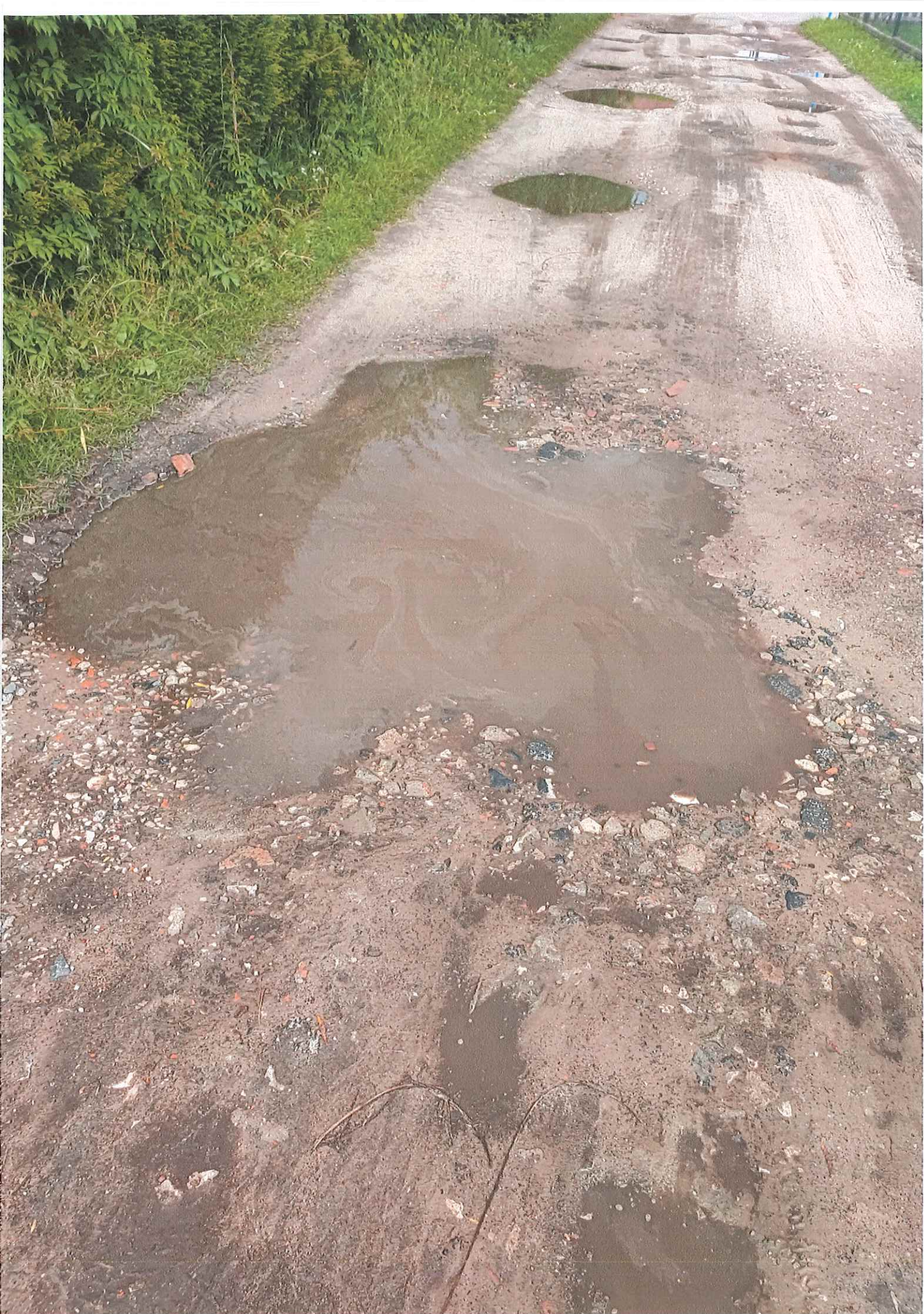
ULICA IDZIKOWSKIEGO 44 C-F