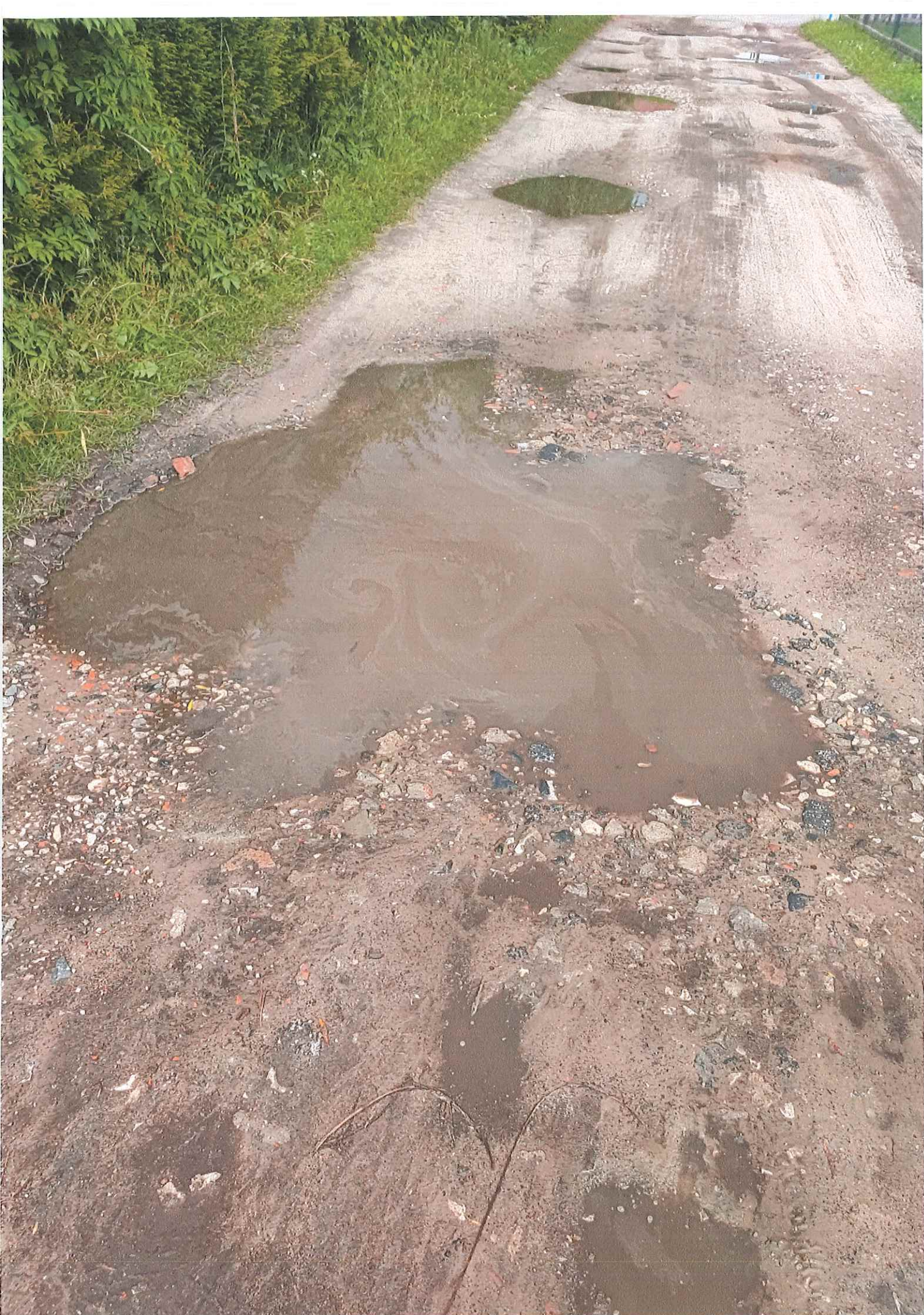
ULICA IDZIKOWSKIEGO 44 C-F