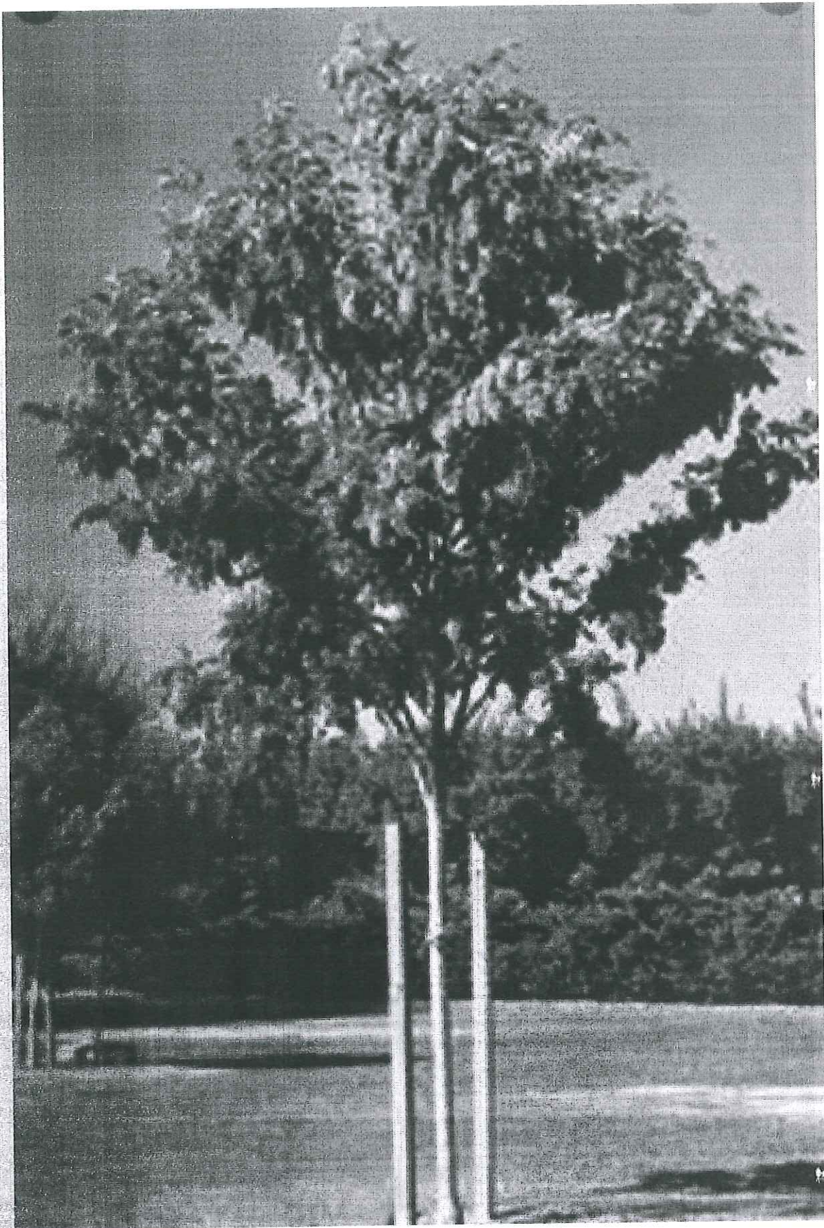
akacja fioletowa szczepiona