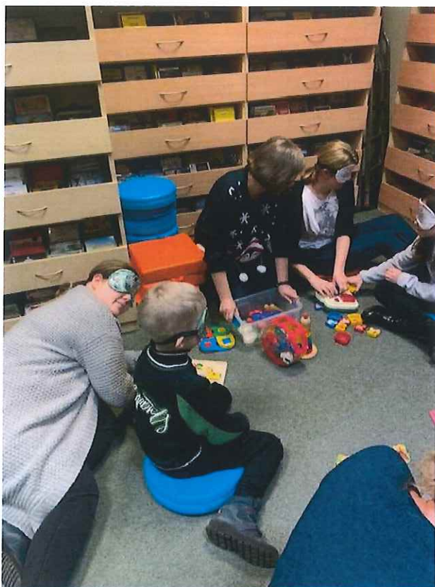
Warsztaty w Punkcie Pomocy Cyfrowej