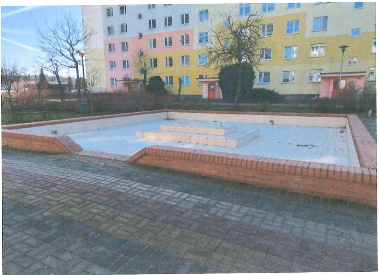
FONTANNA w lokalizacji Witosa 1-3