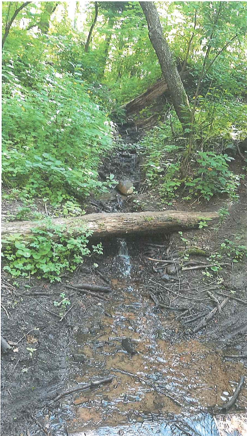
Strumień zasilający Kacze Doły

* Jeśli realizacja wymaga współpracy z podmiotem zewnętrznym **Informacja nieobowiązkowa