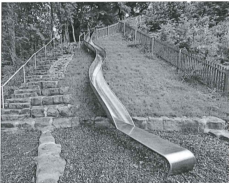
Figura 2. Przykładowa zjeżdżalnia terenowa typu otwartego.