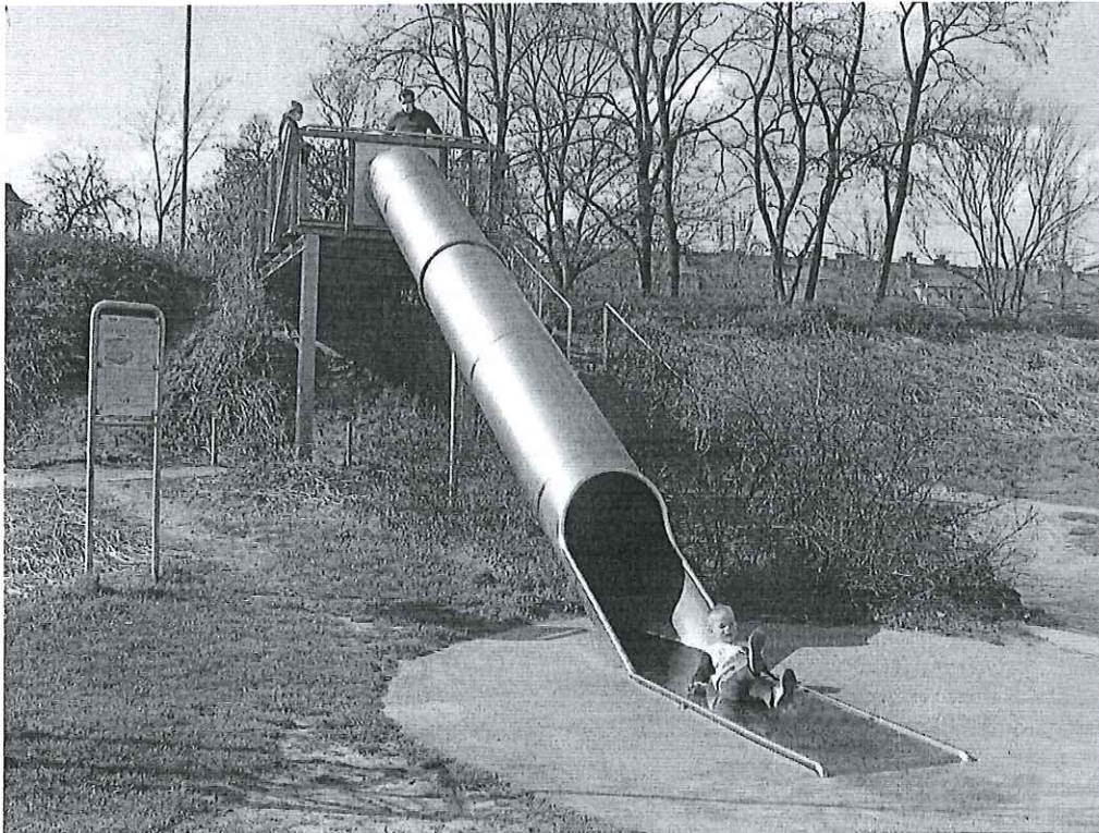
Figura 1. Przykładowa realizacja zjeżdżalni terenowej „zamkniętej”