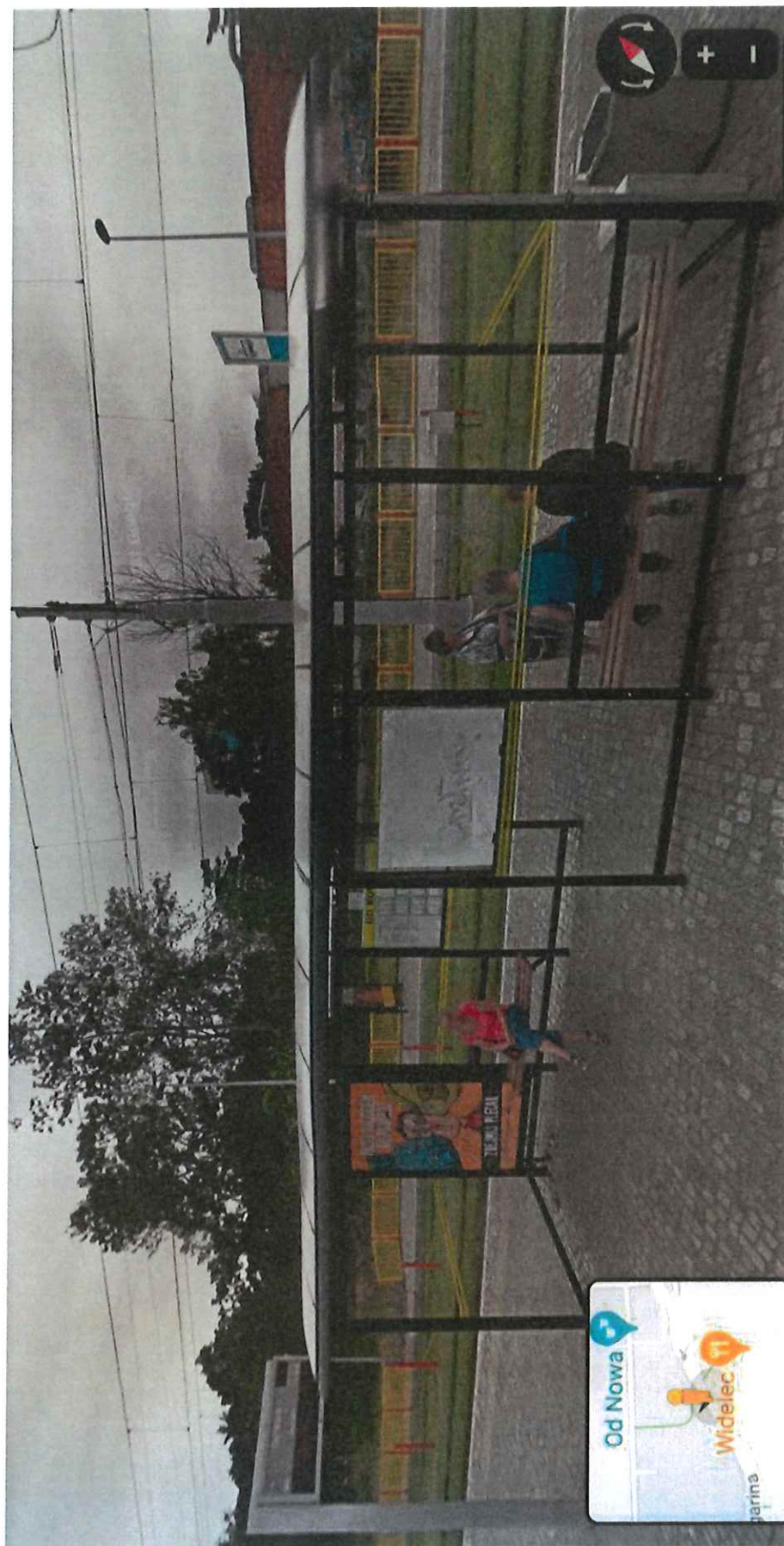
Wiata dwustronna w kształcie litery „S”