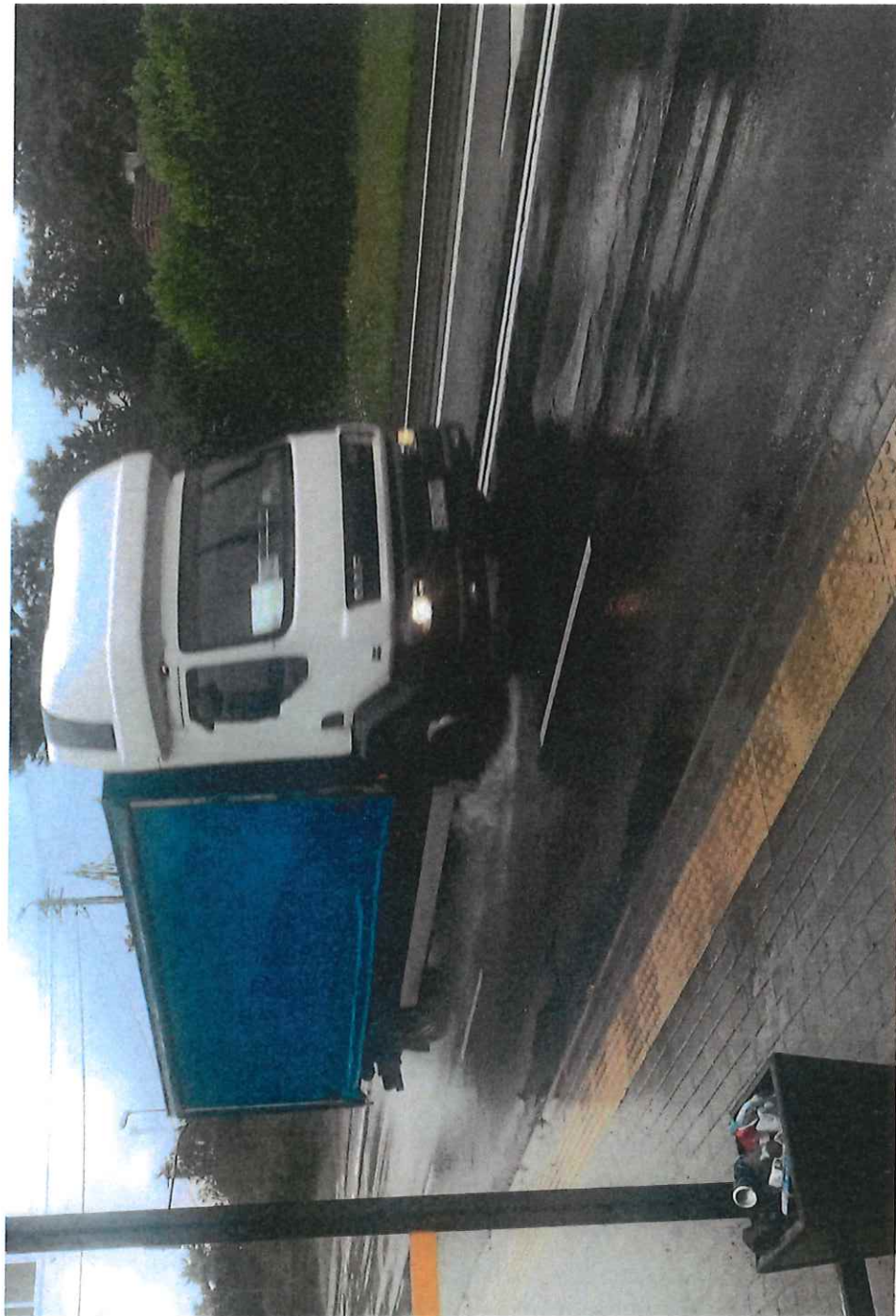
Ujęcie pędzącego samochodu w czasie deszczu