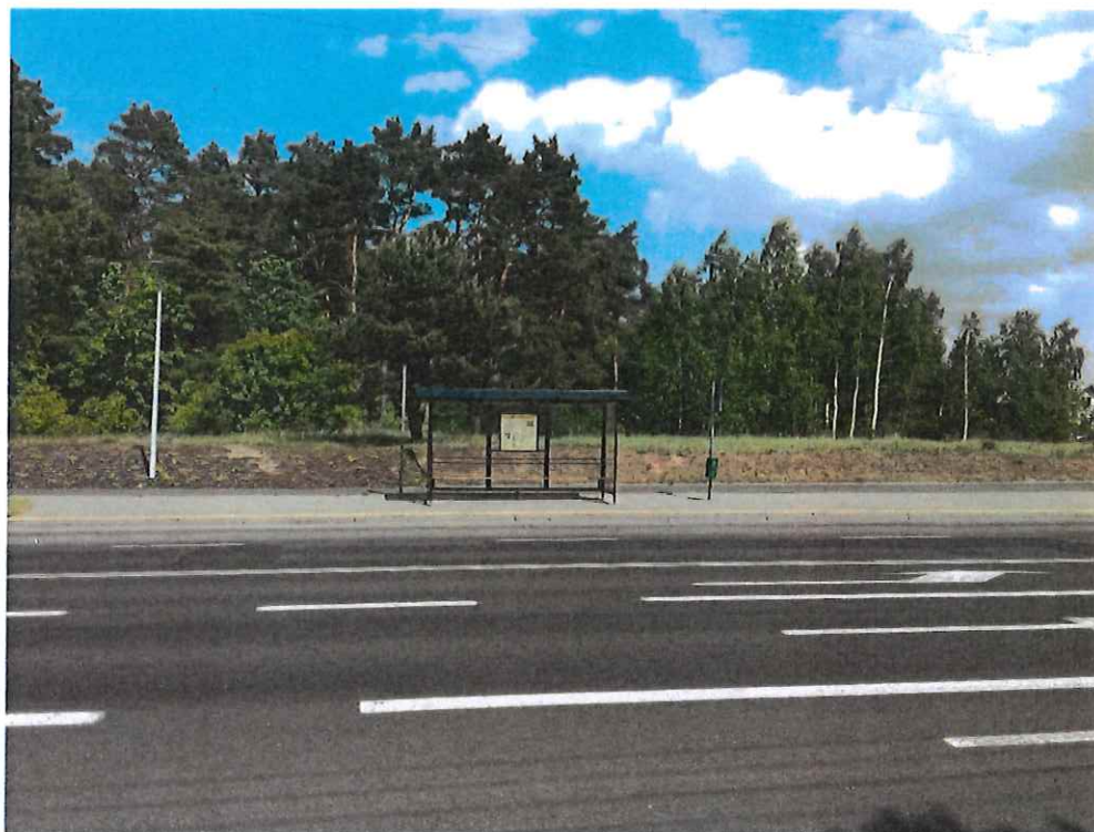
Obecnej widok wiaty autobusowej