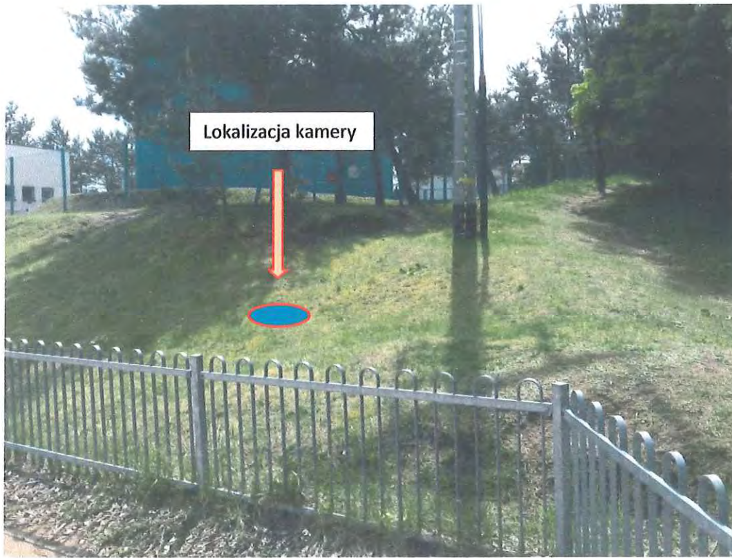
Proponowana lokalizacja kamery