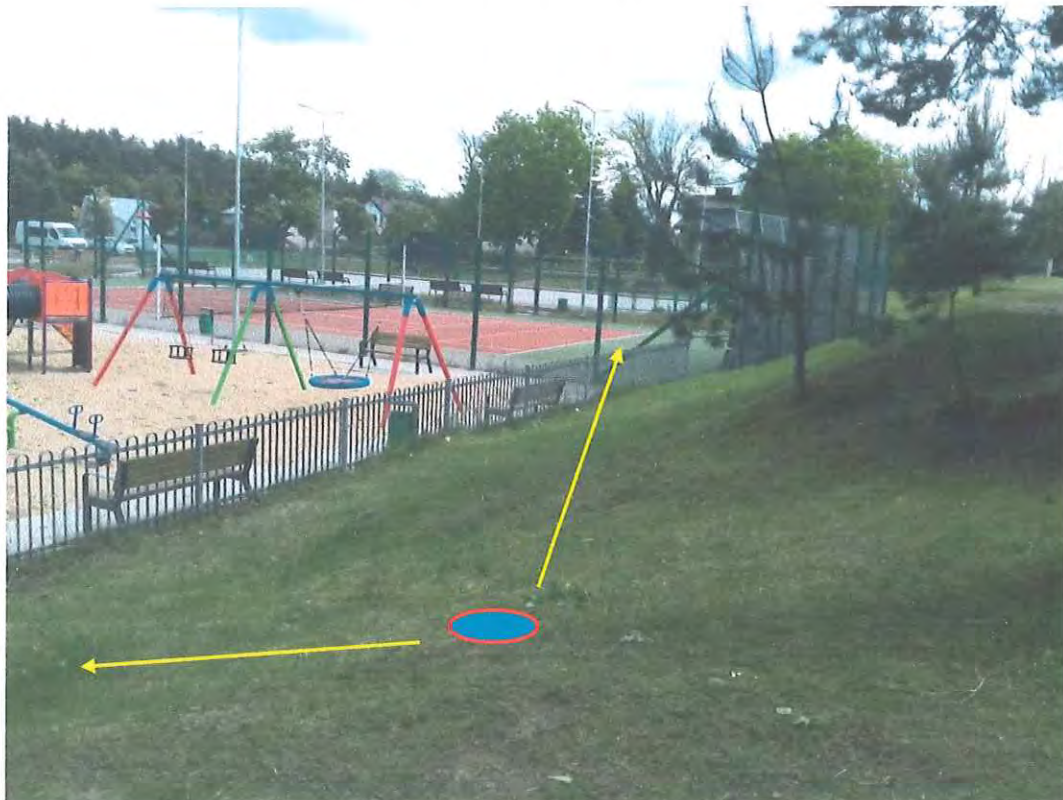
Orientacyjny zakres monitorowania terenu rekreacyjno-sportowego