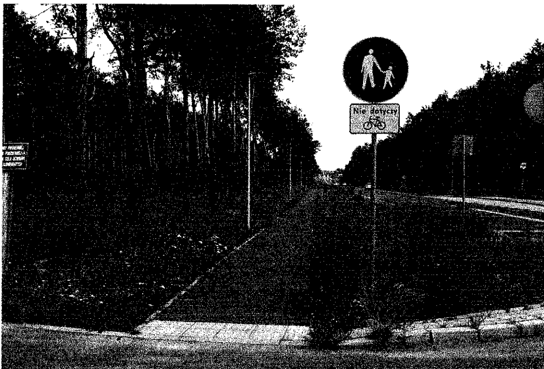
Ścieżka pieszo-rowerowa przy ul. Łódzkiej, przy skrzyżowaniu z ul. Solankową, widok w kierunku wjazdu do Czerniewic