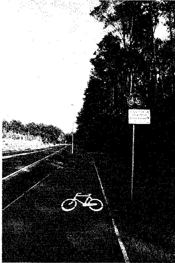
Ścieżka pieszo-rowerowa przy ul. Włocławskiej, wjazd od strony ronda im. Ludmiły Roszko, widok w kierunku Osiedla Solanki