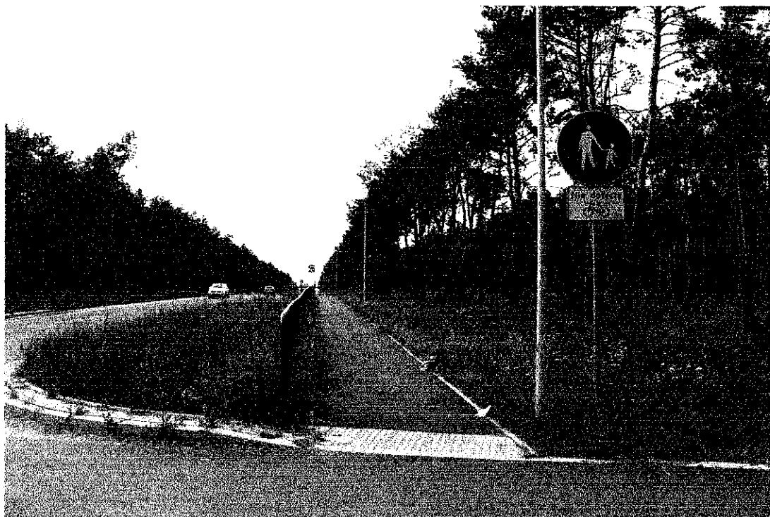
Ścieżka pieszo-rowerowa przy ul. Łódzkiej, skrzyżowanie z ul. Solankową, widok w kierunku ronda im. Ludmiły Roszko