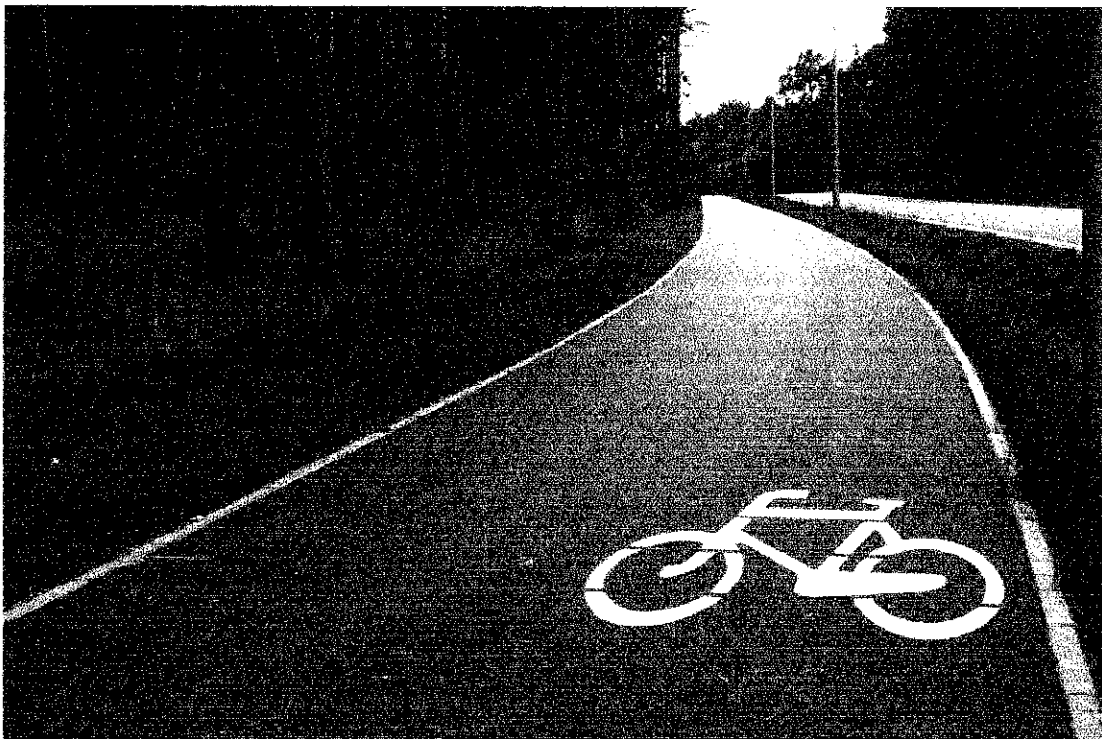
Ścieżka pieszo-rowerowa przy ul. Włocławskiej, fragment, widok w kierunku ronda im. Ludmiły Roszko