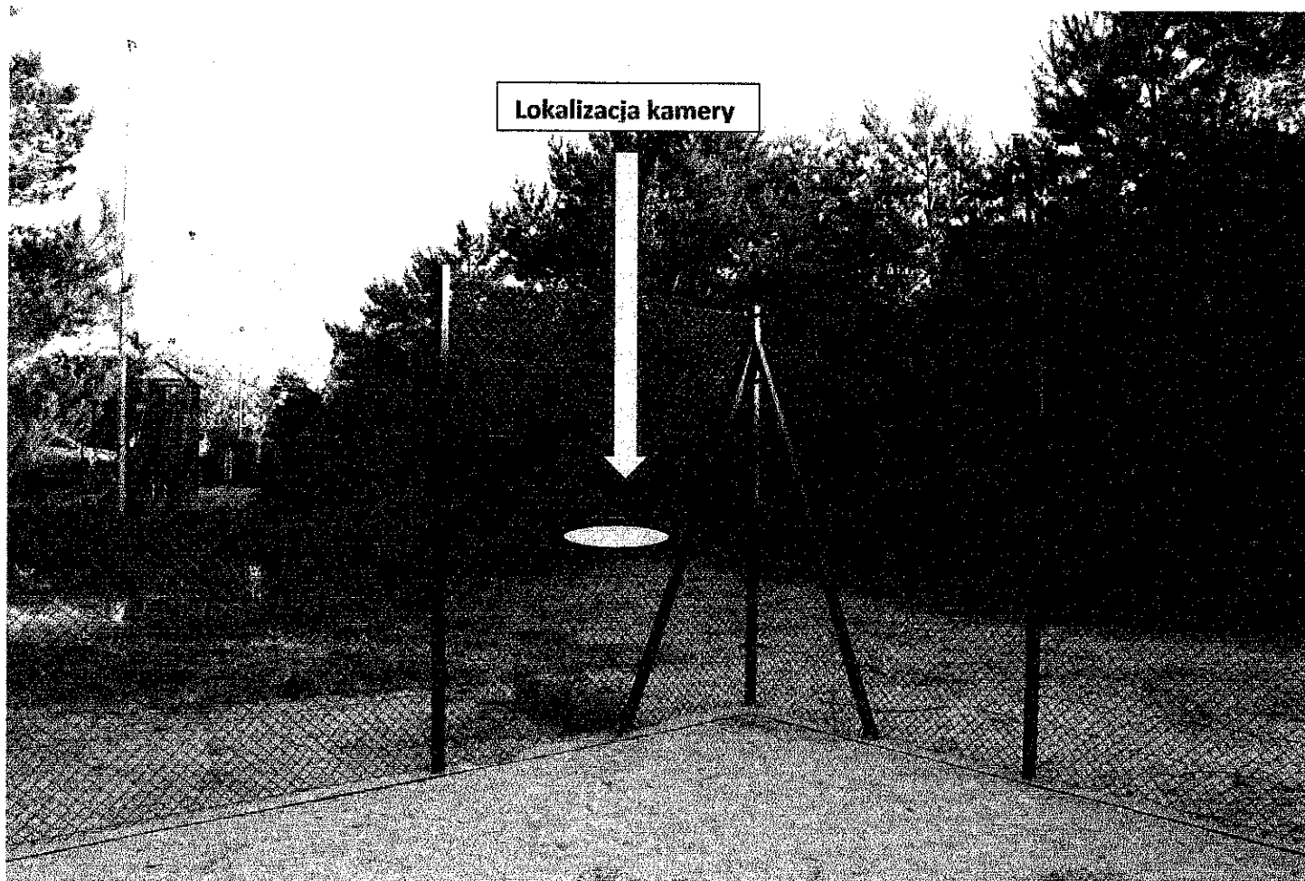
Proponowana lokalizacja kamery