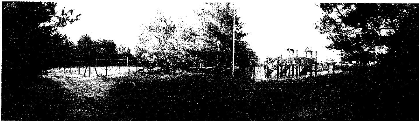
Orientacyjny zakres monitorowania obiektów rekreacyjno-sportowych