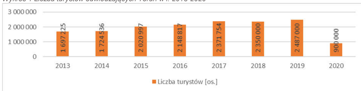
Wykres 1 Liczba turystów odwiedzających Toruń w l. 2013-2020

Źródło: opracowanie własne na podst. danych OIT