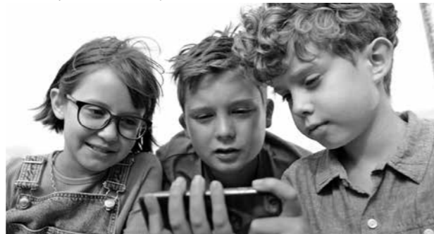
Kadr z filmu Opowieści Franka

Młode Kino. Kujawy i Pomorze 2-6.10. (środa-niedziela)