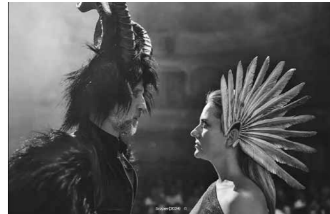
Kadr z filmu Sezony

godz. 17.00 Sezony – komedia, reż. Michał Grzybowski, 100 min godz. 19.00 Jeszcze wyżej – niemy, komedia, reż. Fred C. Newmeyer, Sam Taylor, 73 min