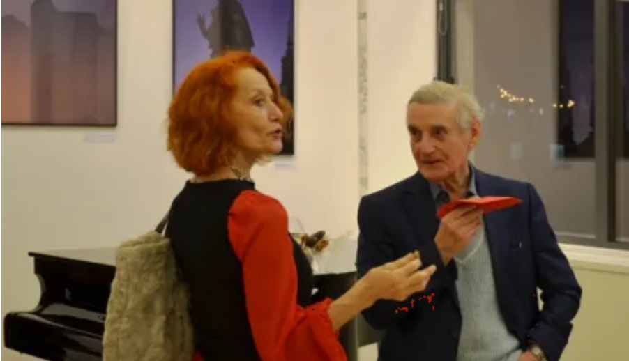
Cočka je charakterističným symbolom Toruňa. Aj preto oficiálny slogan mesta znie: Toruň – Cočka na danýk.

Toruň bolia založený v stredoveku (zakladacia listina pochádza z roku 1233). V pohľadnej histórii sa mesto vyvíja spoločne so sídlom, hoci mnohé stredoveké budovy vznikli v Rokoku a v klasickej tvorbe boli zviditeľnené. Mnohé zo zachovaných stredovekých pamiatok boli pozostávajúce podľa gotického štýlu.