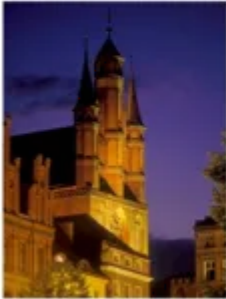
stredovekého a gotického dedičstva. V Toruni bolo podstatných množstvo stredovekých budov, ktoré sa zachovali do dnešných dní a vďaka reprezentujúce najvyššie a gotické

Ďalším z argumentov, ktoré viedli k zápisu torunského Starého mesta na Zoznam svetového dedičstva UNESCO a deň 12. júna 1997, bola autentická jeho stredoveká a gotická profília, a mimoriadne výjavné zachovanie