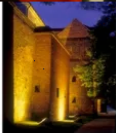
výjavné architektoniky v severnej Európe. Unikátne mestské rozloženie, ktoré sa zachovalo vďaka blízkosti pohraničným, je rovnako materijálnym prejavom prvej dejiny mestského vývoja v stredovekej Európe.

V stredoveku bolo Toruń spojený s mnohými významnými historickými udalosťami. Zohrala dôležitú úlohu pri chríšťianskosti a helénskej Právka, bola hlavným spojenstvom medzi katolíckou kresťanosťou a vplyvom Európy a najmä kresťanskou ortodoxiou a tejto dala Toruń pre formovanie stavební identity mestianstva. Toruń je tiež zapísaný medzi sedem historických mestier Poľska.