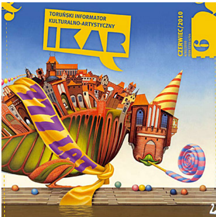
Ikar nr 82, czerwiec 2010