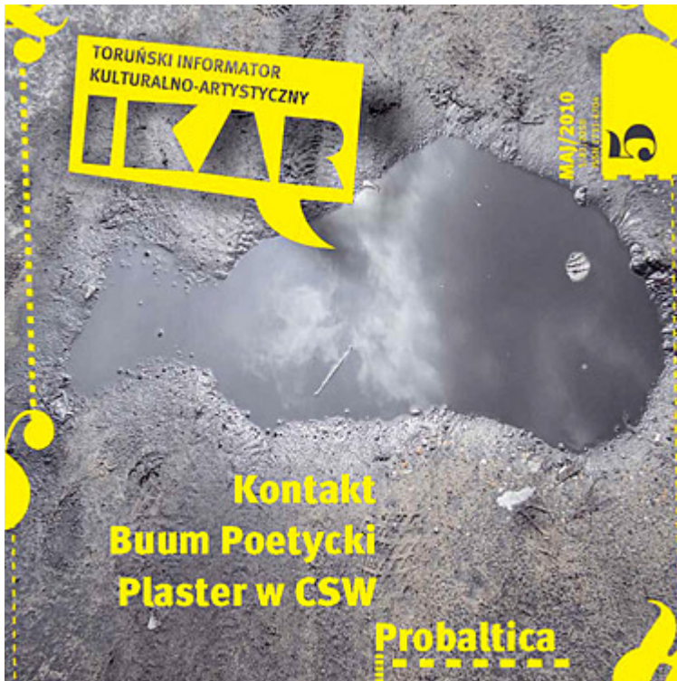
Ikar nr 81, maj 2010