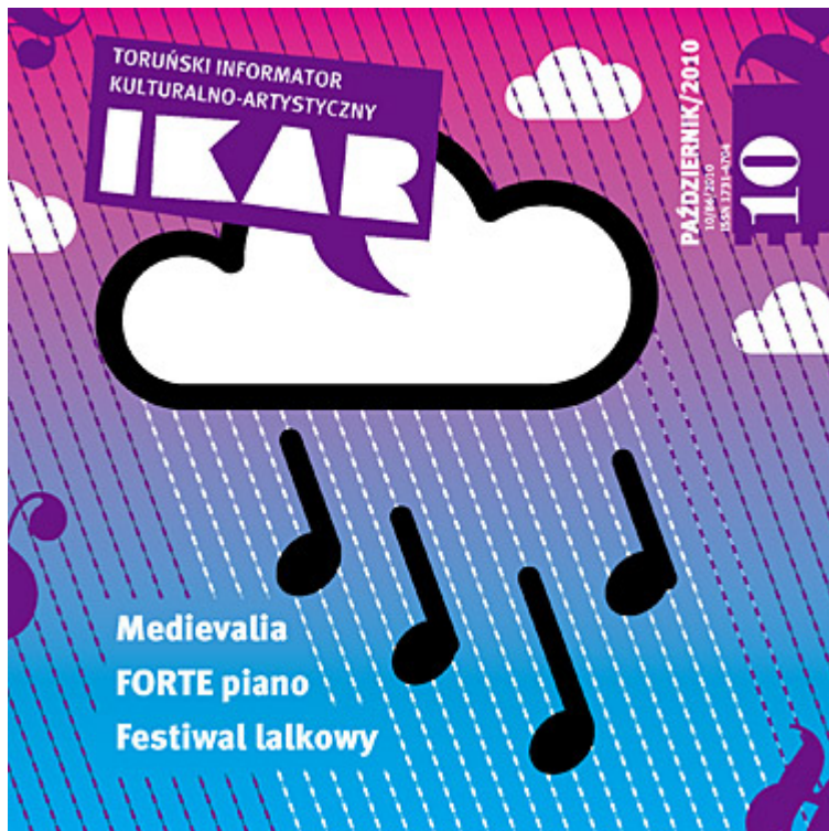
Ikar nr 86, październik 2010