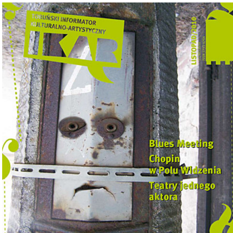
Ikar nr 87, listopad 2010