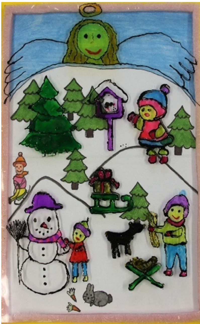
Praca Hani Kubickiej

Dzieci dostały w nagrodę gry edukacyjne, książki i sprzęt sportowy. Ponadto obejrzały film pt. „Dino mama”.