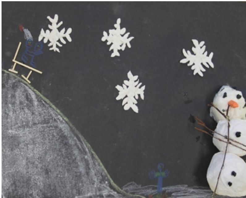
Praca Patryka Wiśniewskiego