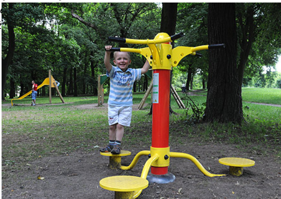
Plac zabaw w parku Glazja

- Wyremontowaliśmy tam także schody od strony ul. Traugutta, a na końcu toru saneczkowego wykonaliśmy nasyp, który zabezpiecza przed wyjazdem sanek na ulicę - mówi dyrektor Wydziału Środowiska i Zieleni UMT, Szczepan Burak. - Glazja to niewiasta, dzięki czemu jest duża