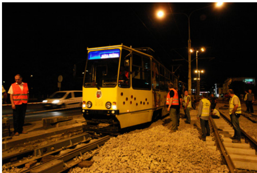
Nocna jazda próbna na skrzyżowaniu Sienkiewicza/Broniewskiego/Bema

Dużo dzieje się też na skrzyżowaniu ul. Sienkiewicza z Broniewskiego: 13 sierpnia przywrócono tam ruch tramwajowy poprzez wykonanie lewoskrętu na skrzyżowaniu Sienkiewicza/Bema/Broniewskiego. Trwają prace przebudowy sieci podziemnych.