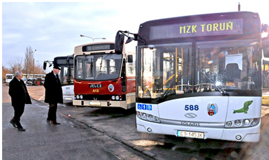
Nowe autobusy mają nowoczesną stylistykę

siedzących (łącznie z kierowcą). Są dostosowane do przewozu osób niepełnosprawnych – w podłodze przy środkowych drzwiach znajduje się specjalna platforma, którą kierowca może w razie potrzeby otworzyć. Na przystankach autobusy pochylają się lekko w stronę chodnika, ułatwiając wsiadanie osobom starszym.