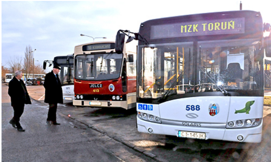
Nowe autobusy mają nowoczesną stylistykę

siedzących (łącznie z kierowcą). Są dostosowane do przewozu osób niepełnosprawnych – w podłodze przy środkowych drzwiach znajduje się specjalna platforma, którą kierowca może w razie potrzeby otworzyć. Na przystankach autobusy pochylają się lekko w stronę chodnika, ułatwiając wsiadanie osobom starszym.