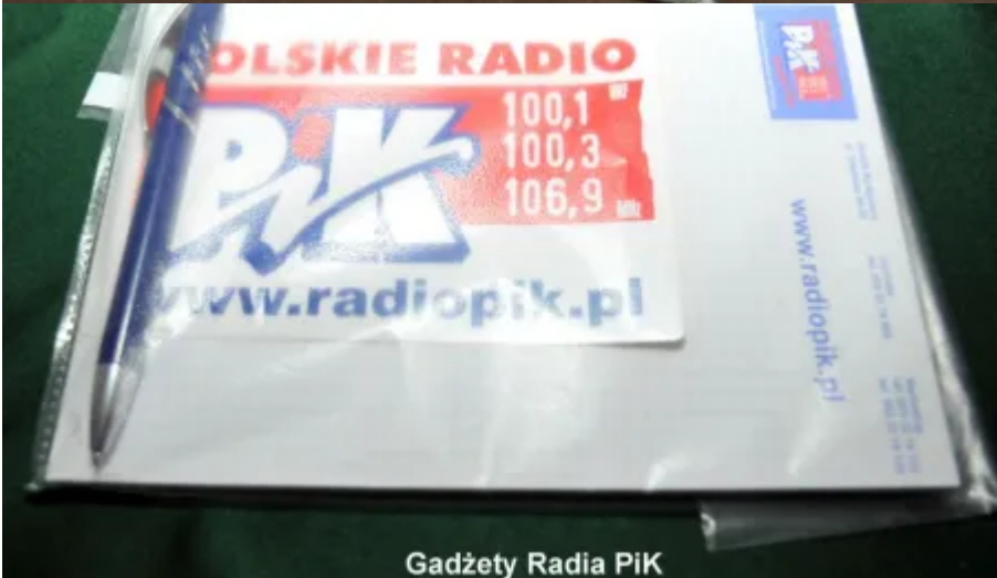
Gadżety Radia PIK