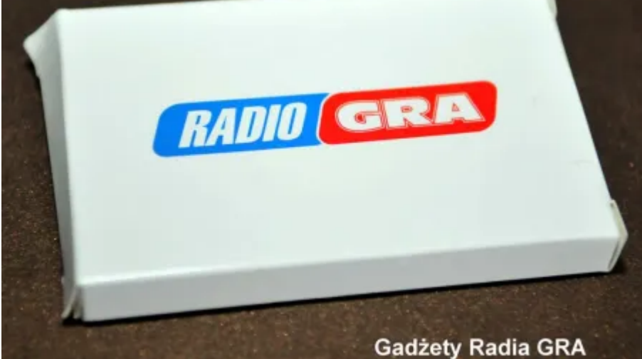
Gadżety Radia GRA