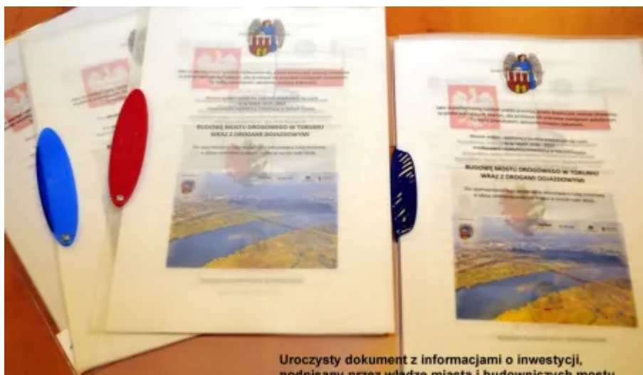
• Uroczysty dokument z informacjami o inwestycji, podpisany przez władze miasta i budowniczych mostu