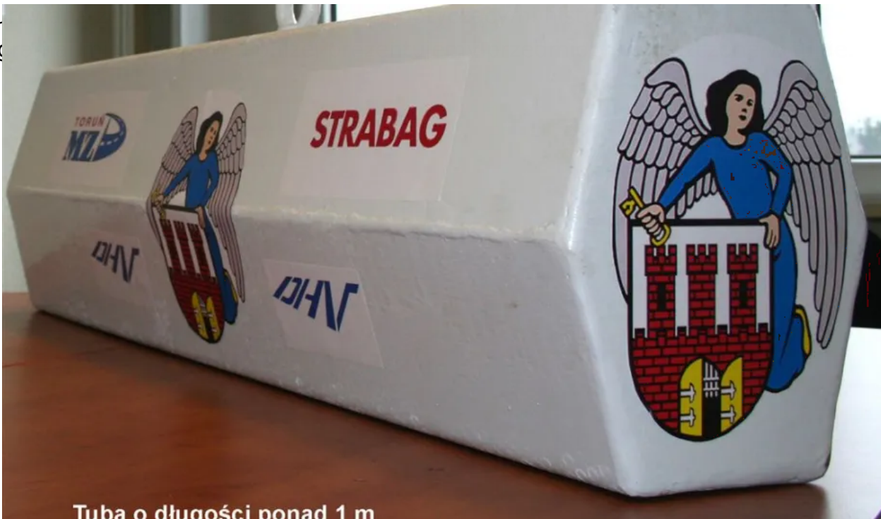
• Tuba o długości ponad 1 m

7 listopada 2013 r. w izbicy centralnej podpory mostu w Toruniu została zamontowana tuba z napisem „STRABAG” i logo „MIASTO TORUŃ”.