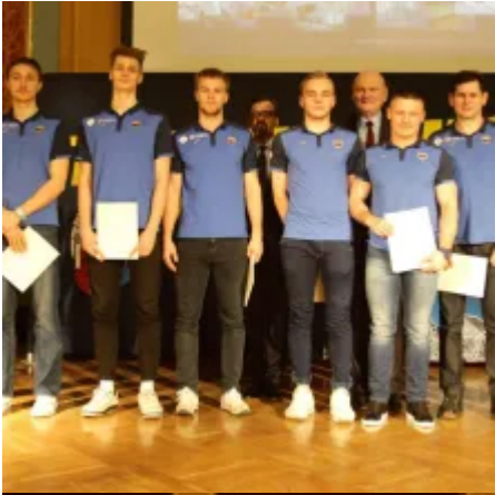
Fot. Adam Zakrzewski