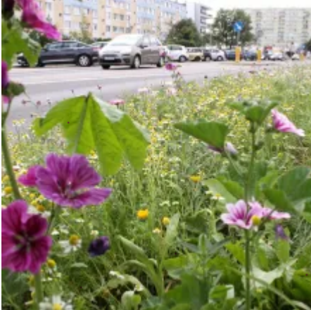
Łąka kwietna przy Muzeum Etnograficznym