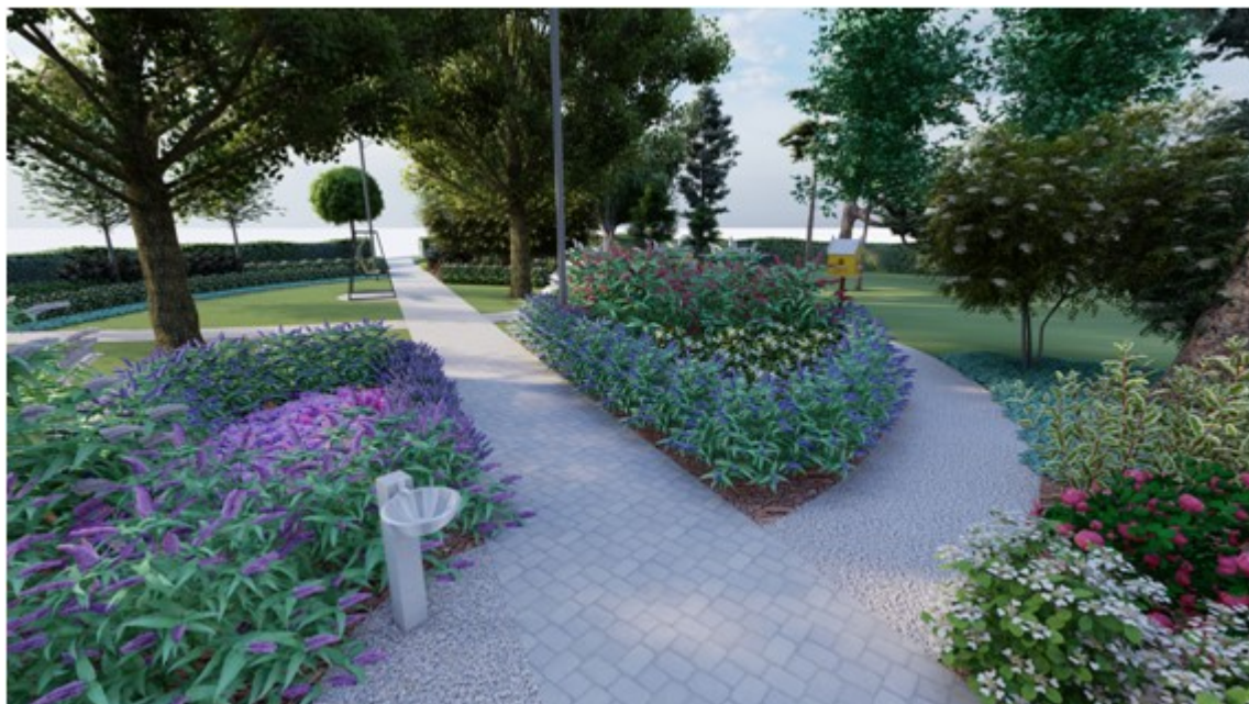
Park "Ukraińskie ustronie" - wizualizacja