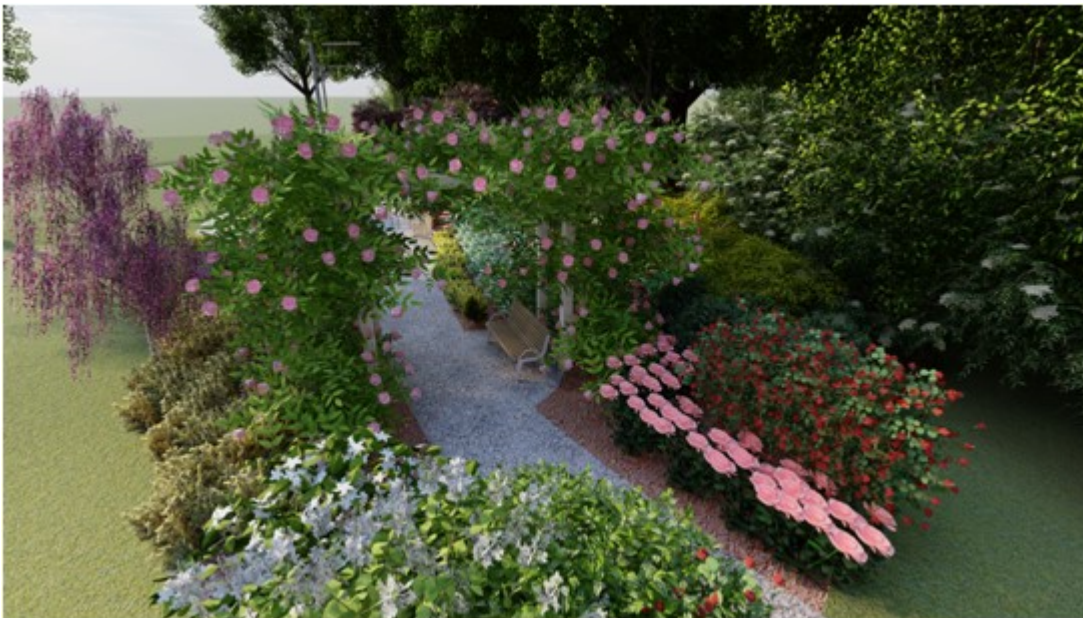
Park "Angielski ogród" - wizualizacja