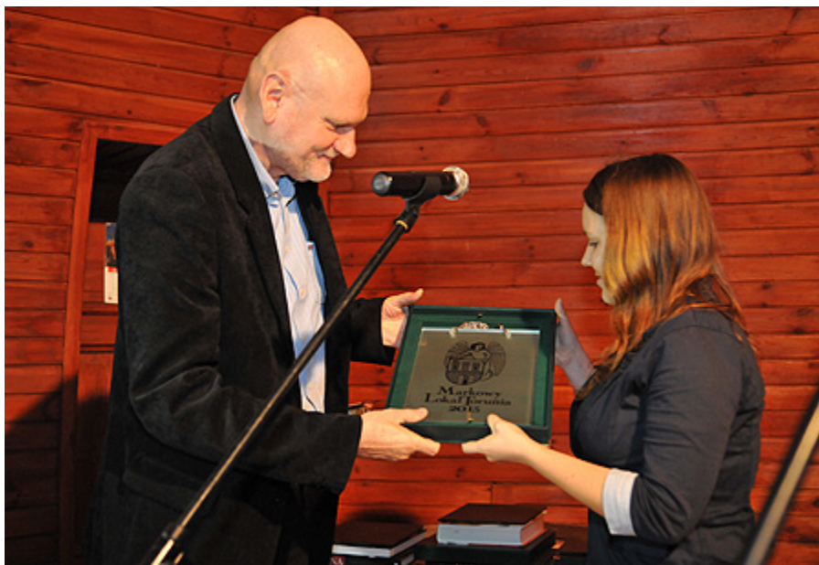
Plakieta Markowego Lokalu Torunia dla Pierogarni "Stary Młyn"

W drugim etapie konkursu finaliści zostali wzięci pod lupę jury. Miejsca kandydujące do tytułu markowego lokalu muszą być bowiem nie tylko chętnie odwiedzane przez klientów, ale także bezpieczne, czyste i niezadłużone. Sprawdzili to przedstawiciele BTCM, Instytutu Socjologii UMK, Straży Miejskiej, Komendy Miejskiej Państwowej Straży Pożarnej, Komendy Miejskiej Policji, Sanepidu, Izby Przemysłowo-Handlowej, oddziału miejskiego PTTK oraz Wydziału Podatków i Windykacji Urzędu Miasta Torunia. Jedną z form badania była „metoda tajemniczego klienta”. Każdy z jurorów przyznał nominowanym lokalom punkty, które po zsumowaniu dały wyłoniły zwycięzców.