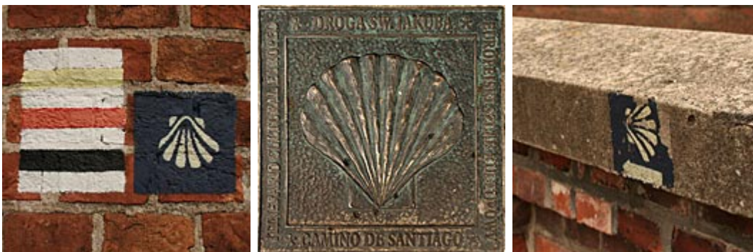
Musze - znaki na toruńskiej części Szlaku